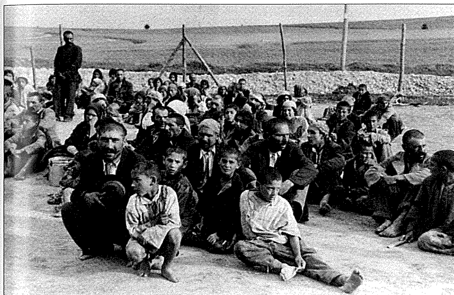
21. Cikáni deportovaní z Říše jsou drženi v táboře u Belzecu, 1940