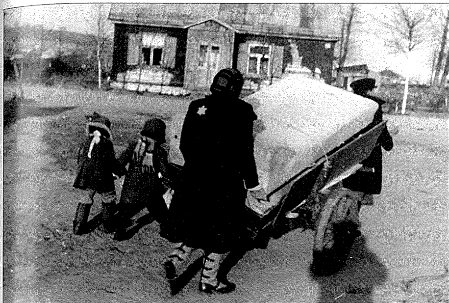
20. Hledání přístřeší v ghettu, Kovno, 1941