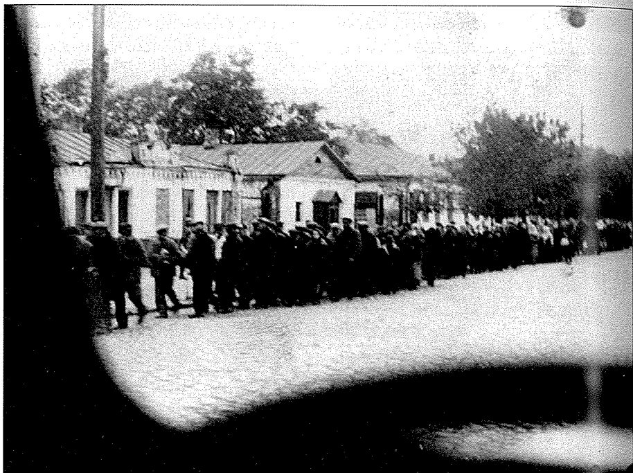
30. Deportovaní maďarští Židé pochodují přes Kamenec Podolský na popraviště, Ukrajina, 27. srpna 1941