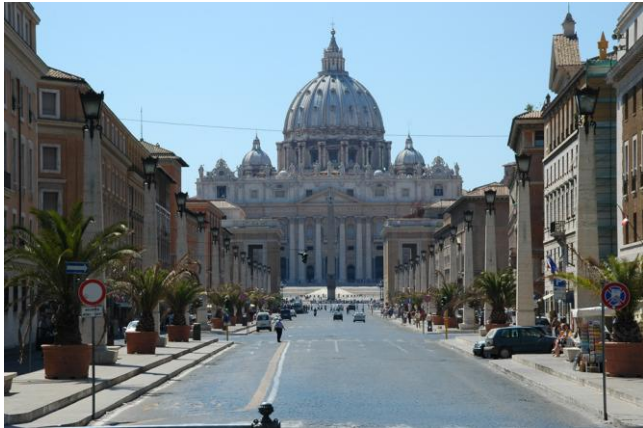
Roma, via della Conciliazione

propagandistica). I maggiori incarichi pubblici sono suoi e il suo stile influenzerà, o in qualche modo verrà imposto, agli altri architetti di regime.