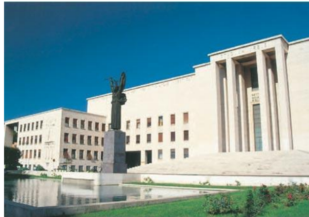
Rettorato dell'Università La sapienza di Roma

1. Nel testo sono presenti questi tre termini riferiti all'architettura: razionalismo , architettura fascista e monumentalismo . Come differenziarli? Provate a spiegarli con parole vostre.