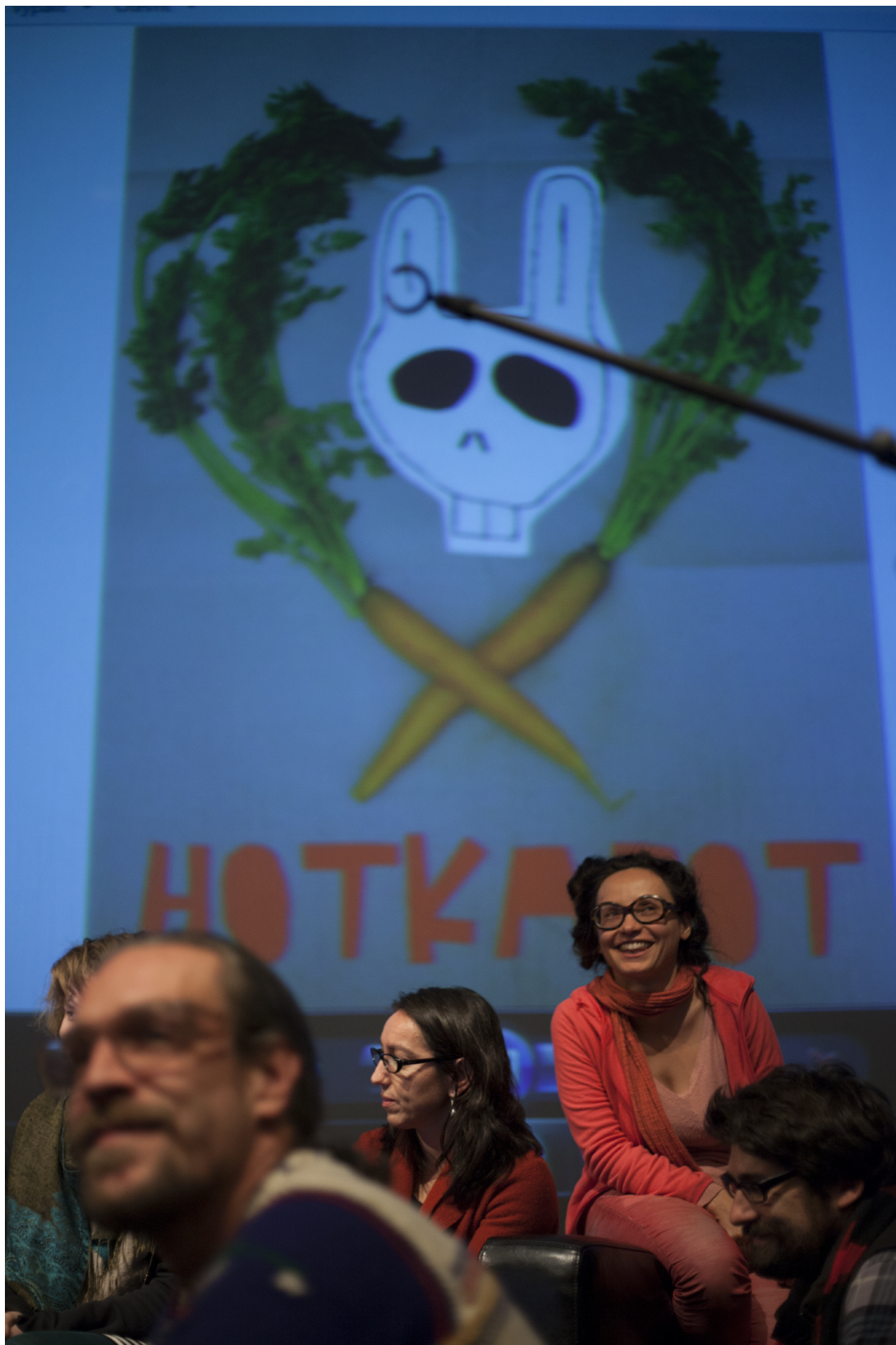
Obr. 10. Závěrečná přednáška konference Nomadic Science BioHackLab a Extreme Metabolic Interactions: Cooking for Apocalypse .