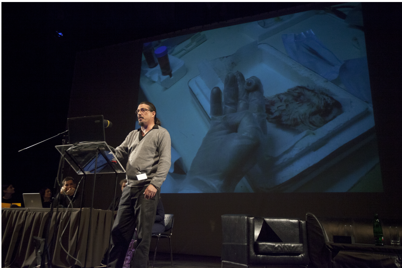
Obr. 2. Oron Catts prezentuje v rámci příspěvku Crude matter: the milieu as life enabling .

V prvním příspěvku Crude matter: the milieu as life enabling Oron Catts a Ionat Zurr navázali na příběh pražského Golema (v překladu znamená „hrubý“, „neopracovaný“), na kterém ilustrovali myšlenku existence života v neživé hmotě a představili svůj projekt, v němž se pokoušejí vytvořit v laboratorních podmínkách život - kožní tkáň - z neživých zvířat, což se jim i daří. Tuto přednášku, která jde opravdu „na dřev života“ můžete vidět zde http://vimeo.com/56462011 .