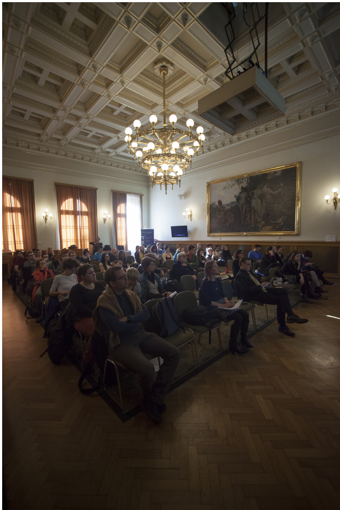
Obr. 15. Prednášková miestnosť na Akadémii vied ČR vrátane pedagógov a študentov TIMu.