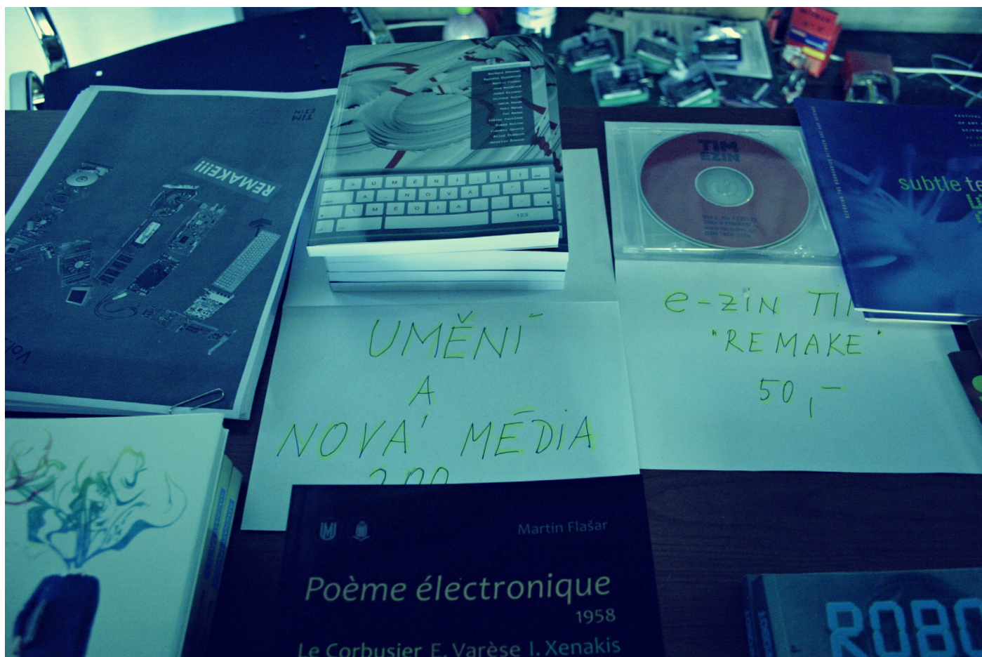
Obr. 20. Publikácie TIMu boli k dispozícii pre návštevníkov konferencie na Novej scéne ND.