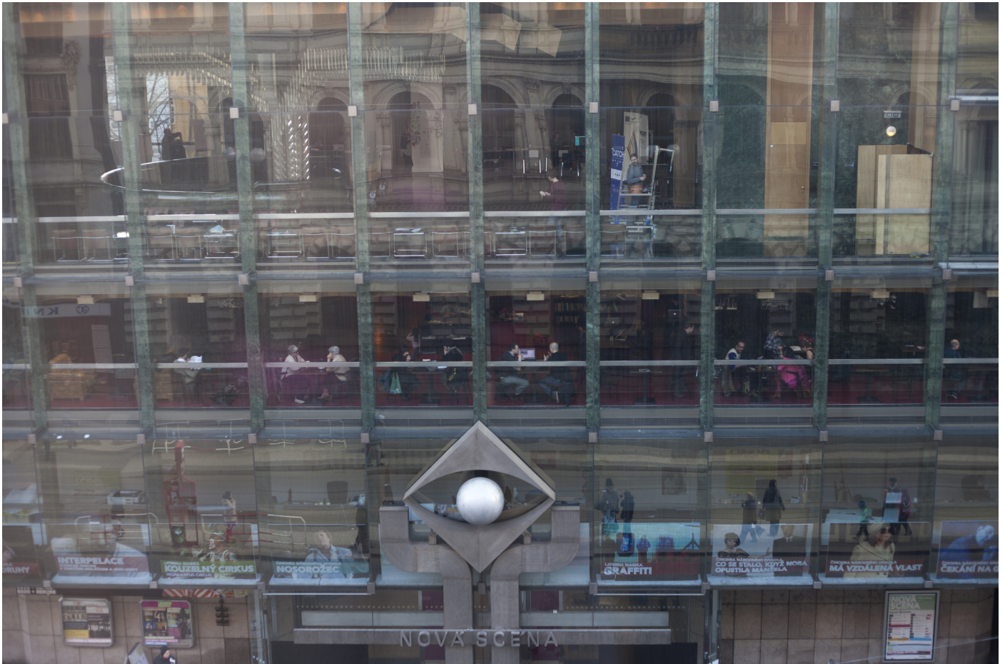
Obr. 13. Priestor k interakcii divákov a aktérov medzinárodnej konferencie: kaviareň Novej scény Národného divadla.

s porozumením niektorých výkladov a textov, a to hlavne z dôvodu náročnosti jej akademického kontextu. Na druhej strane bola práve už zmienená multikulturalita jedným z dôvodov veľmi uvoľnenej a priateľskej atmosféry konferencie, ktorá poskytovala mnoho príležitostí ku komunikácii a interakcii medzi akademikmi, umelcami a publikom.