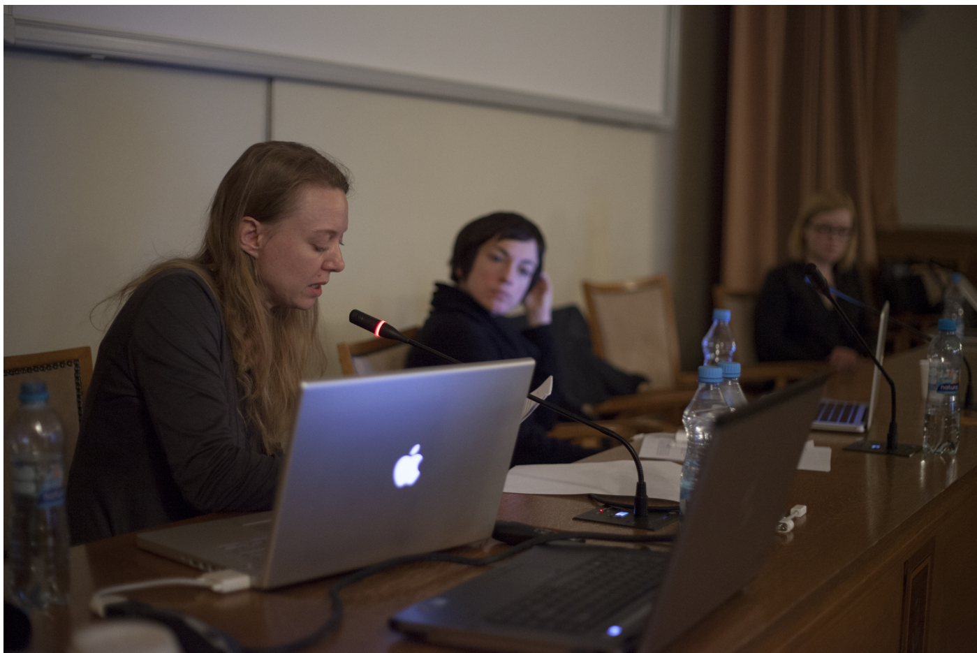
Obr. 9. Jedna z posledných prednášok konferencie MutaMorphosis v priestoroch Akadémie vied ČR Addressing the Future: The Tactics of Uncertainty.

Záverečná prednáška konferencie s názvom Nomadic Science BioHackLab a Extreme Metabolic Interactions: Cooking for Apocalypse predstavila spoločne DIY (do it yourself = urob si sám) biológov a bio-hackerov. Najväčší divácky záujem snád' vzbudil projekt Hot Karot pražských študentiek nových médií ( http://www.vyvarovna.com/2011/12/hot-karot-mrkev-v-rohliku.html ). Myšlienkou bolo hackovanie tradičného hot dogu, ktorý síce nie je zdravý, ale je lacný, tým, že ho autorky zamenili za mrkvu v celozrnnom rohlíku.