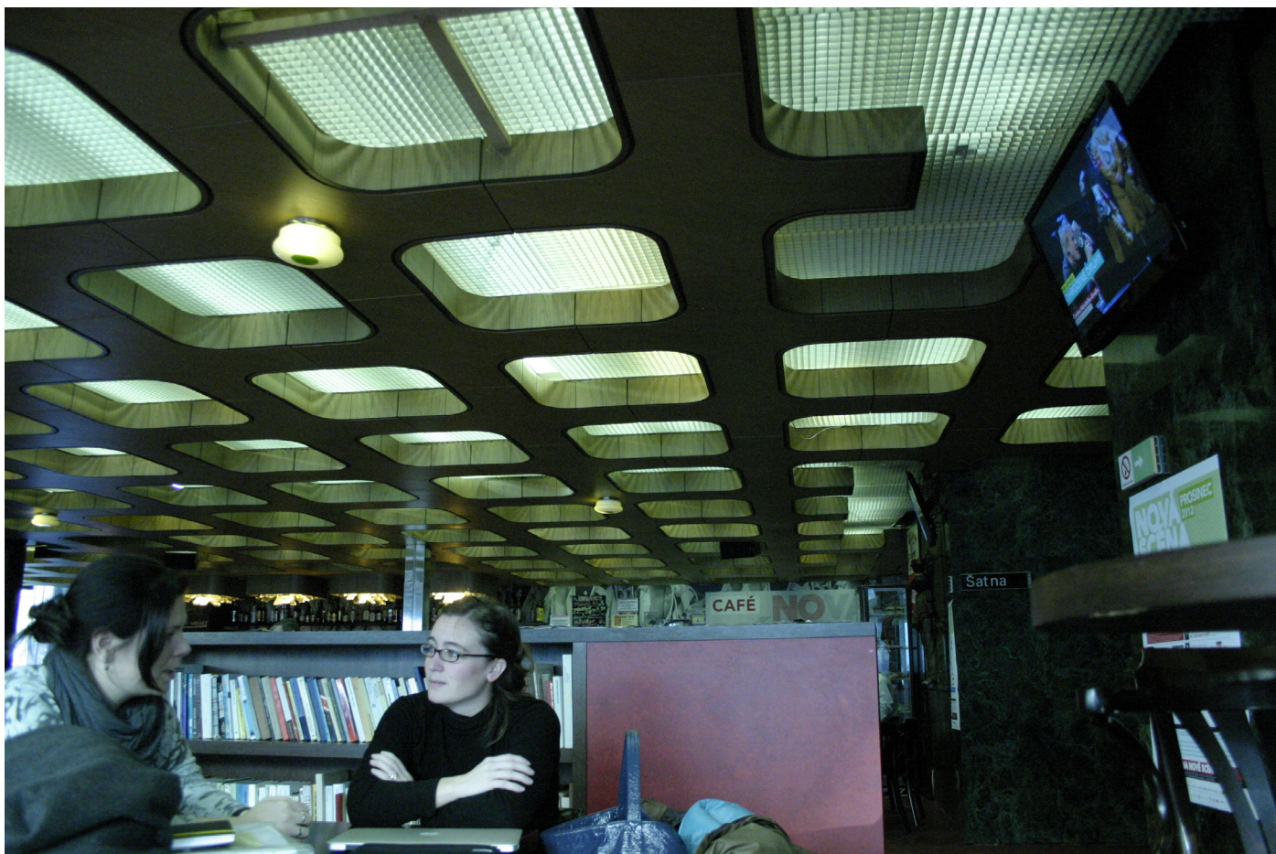
Obr. 19. Kaviareň na Novej scéne Národného divadla ako miesto stretávania účastníkov konferencie.