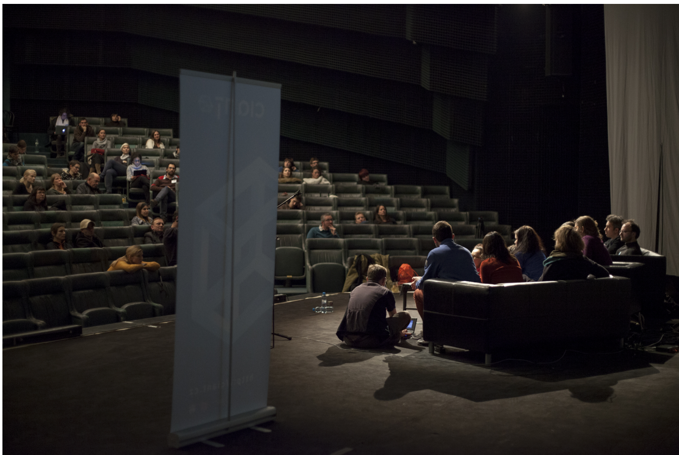
Obr. 12. Publikum Novej scény ND počas posledného vstupu konferencie.

V mnohých ohľadoch bola táto diskusia zhrnutím toho, čo sa doposiaľ deje v hackerskom priestore a oslavou DIY biológie.