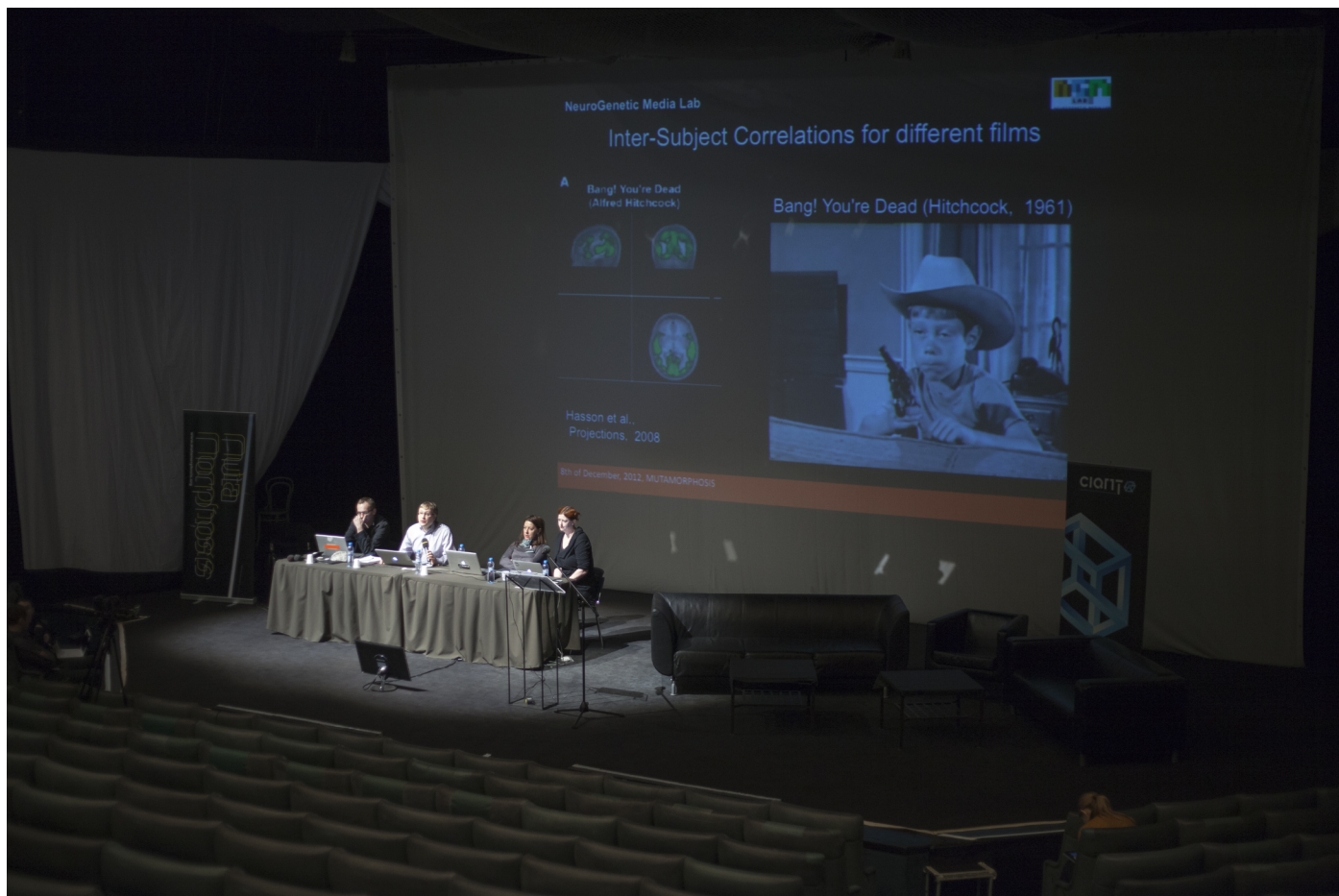
Obr. 8. Prednáška Neurogenetic Media: From Research Tool to New Art Applications na Novej scene.