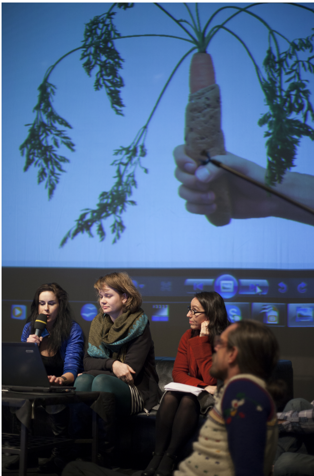
Obr. 11. Projekt Hot Karot pražských študentiek nových médií.

Mrkva ako náhrada hot dogu putovala najprv medzi ľuďmi na ulice, neskôr do kyberpriestoru. Mala podnieť zmenu myslenia o jedle a vizualizácii jedla. Išlo predovšetkým o hackovanie kuchárskych praktík, o rezistenciu mrkvy, kým na nej skúšali rôzne experimenty, vypestovanie nového tvaru a druhu mrkvy.