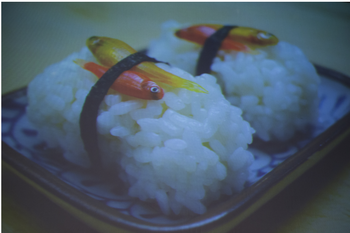
Obr. 17. Ukázky DIY biológov bio-hackerov na téma gastronómie vrámci záverečnej prednášky konferencie.