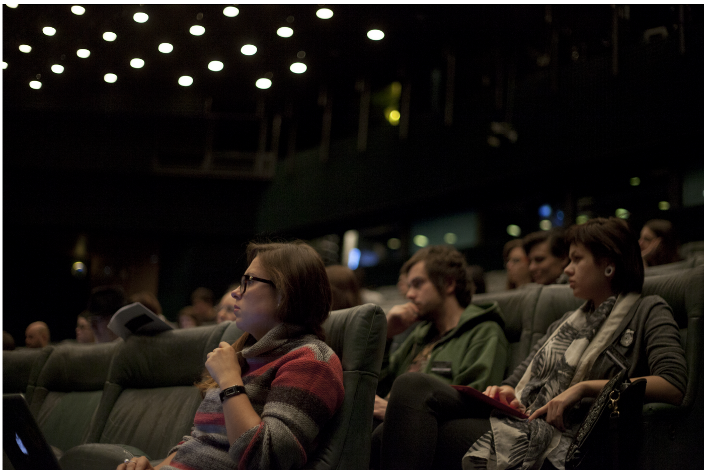
Obr. 14. Priestory Novej scény Národného divadla dodávali konferencii veľmi príjemnú atmosféru.