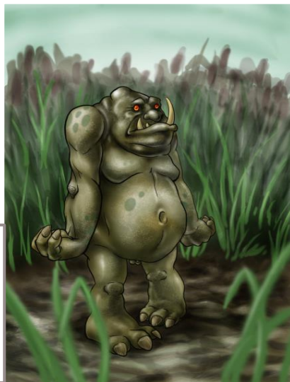
Jožin z Bažin (沼泽里的怪物) zhǎo zé lǐ deguàiwù)