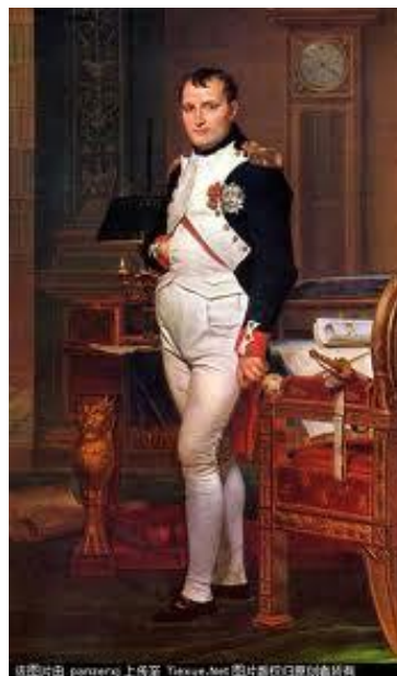
拿破仑 ná pò lún