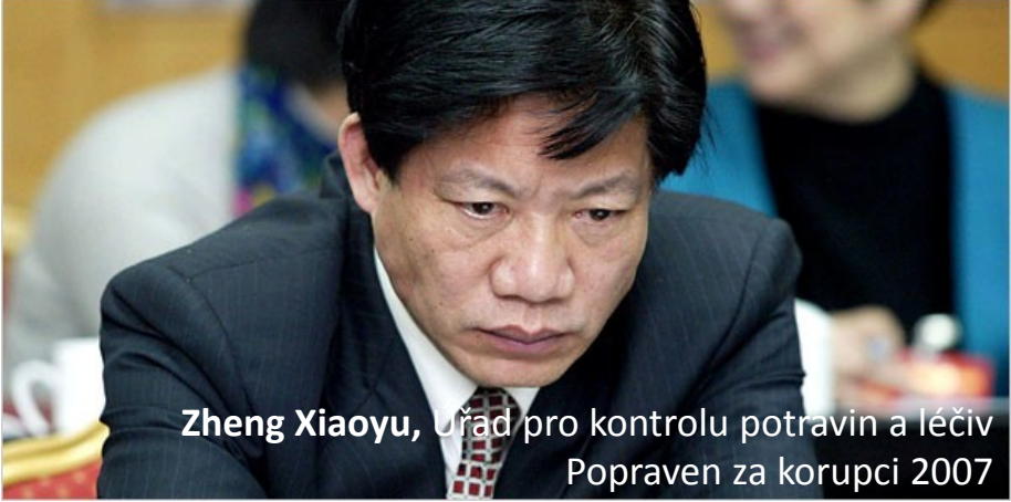
Zheng Xiaoyu , Úřad pro kontrolu potravin a léčiv Popraven za korupci 2007