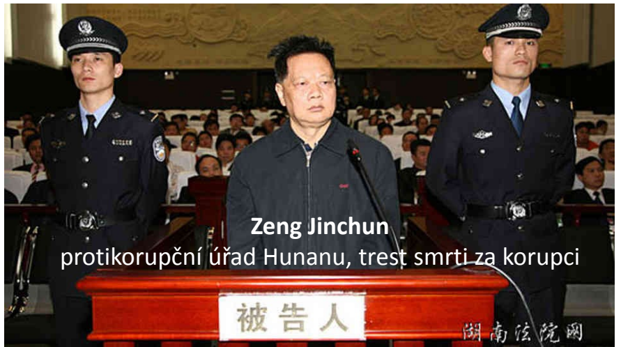
Zeng Jinchun protikorupční úřad Hunanu, trest smrti za korupci