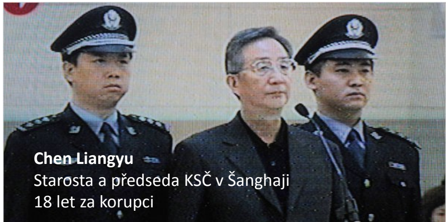
Chen Liangyu Starosta a předseda KSČ v Šanghaji 18 let za korupci