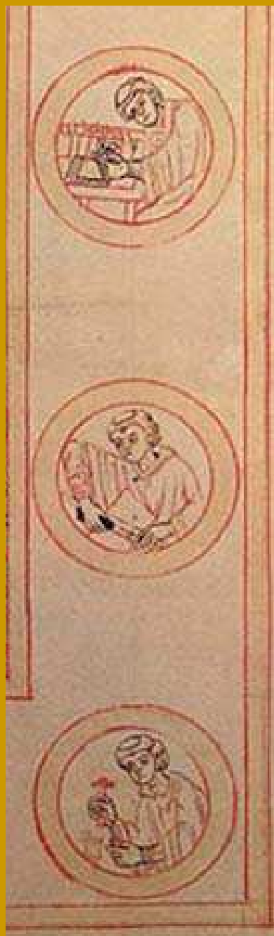
Bamberg, Staatsbibliothek MS Patr. 5, fol. 1v

http://www.getty.edu/art/gettyguide/videoDetails?segid=4260