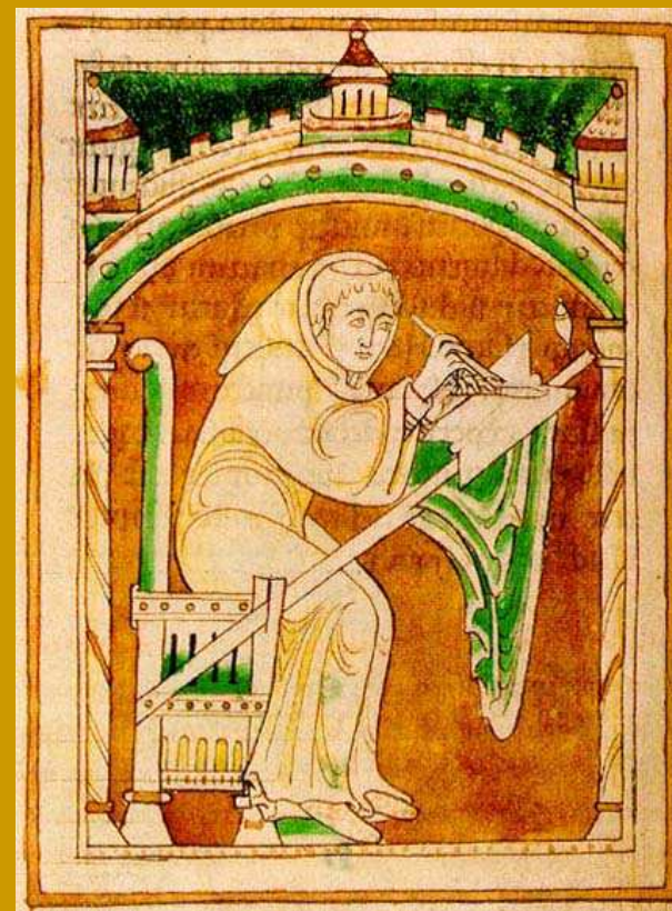
Durham, University Library, Ms. Cosin V III 1, fol. 22v