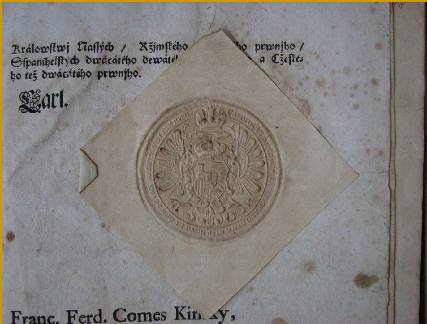
pečeť přitištěná pod papírovým krytem