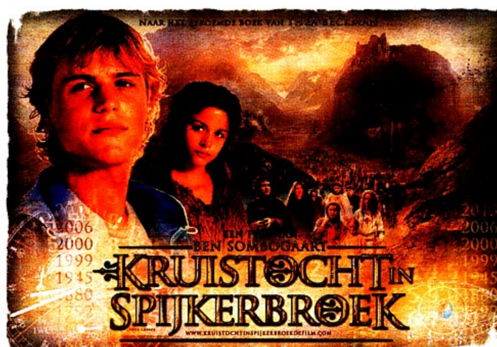
Kruistocht in spijkerbroek (door Ben Sombogaart) is een van de laatste Nederlandse films die in de originele versie succes hadden in Vlaanderen.

Omgekeerd moet gezegd worden dat de Vlamingen meer open stonden voor Nederlandse films: populaire komedies, van André Van Duin tot Flodder , en ook thematisch oer-Hollandse films als Een vlucht regenwulpen , Ciske de Rat en Op hoop van zegen kenden in Vlaanderen een ruime distributie en konden mooie bezoekcijfers voorleggen. Ook dat is verklaarbaar: in de jaren 70 en 80 keken de Vlamingen massaal naar de Nederlandse zenders, die met name met de grote zaterdagavondshows een marktaandeel haalden van 30% (!) en meer. Nederlandse sterren waren bijgevolg ook sterren in Vlaanderen. Filmprogramma's als Simonskoop of de quiz Voor een