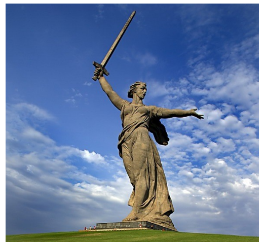
скульптура "Родина-мать зовёт"