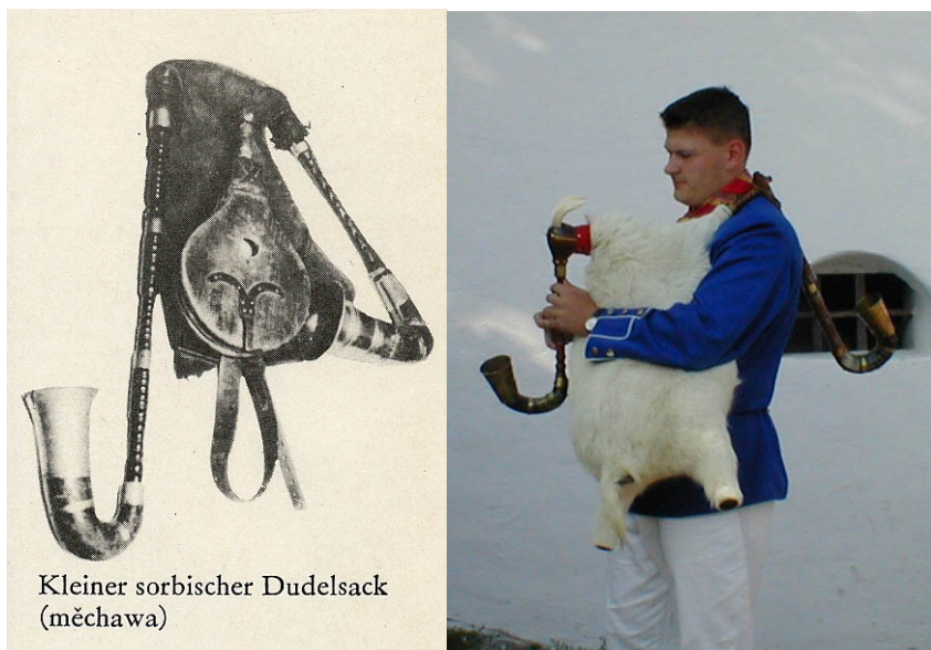
Kleiner sorbischer Dudelsack (měchawa)

Vzduchový zásobník měchawy je z oholené telecí kůže. Kratší píšťala, která ční dopředu má osm tónových otvorů, je celá ze dřeva, jen její zahnutý konec může být vyroben z rohu, který bývá na samém konci opatřen mosazným plechem. Zvuk je tvořen rákosovým plátkem. Delší bourdonová píšťala hraje neustále jeden hluboký tón. Aby nemusela být tak dlouhá vzhledem k hlubokému tónu, který tvoří, je opatřena dvojitým mosazným kolenem. Je rovněž dřevěná a její zahnutý konec může být také z rohu a mosazi. Způsob tvoření tónu je shodný jako u přední píšťaly. Tón, který bourdonová píšťala vydává je velké F (z čehož vyplývá pro dudáky nejčastější tónina F dur); Přední píšťala pak hrála melodii ve vzdálené jednočárkované oktávě. 15