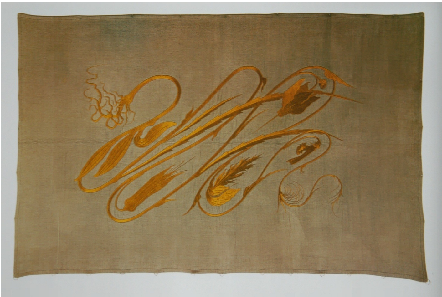
Hermann Obrist, Brambořík (Rána bičem), výšivka, cca 1895