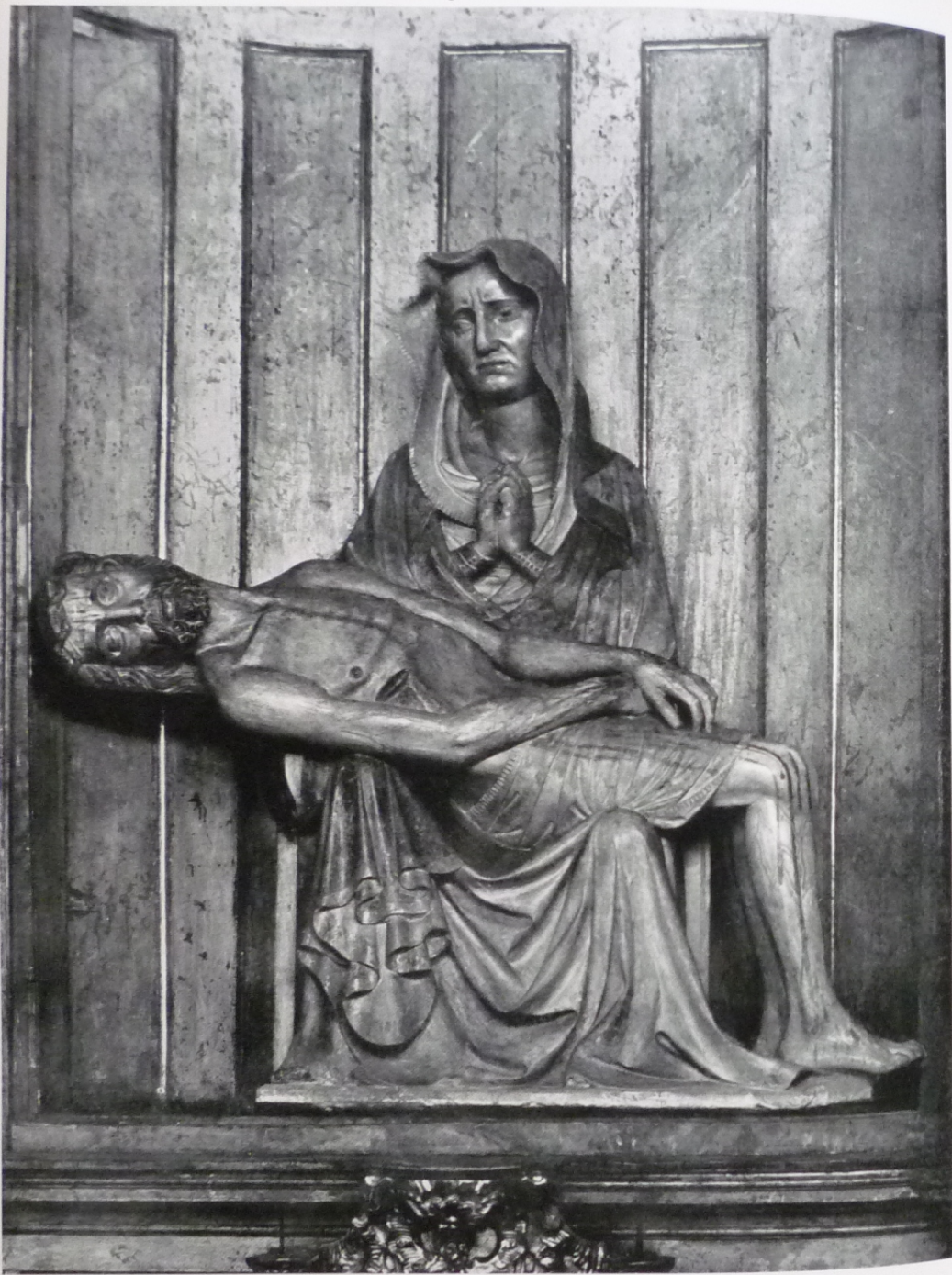
120. PIETA, BRNO, SV. TOMÁŠ, KOLEM 135.