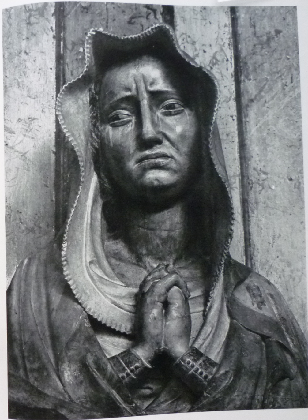
121. PIETA, DETAIL, BRNO, SV. TOMÁŠ.