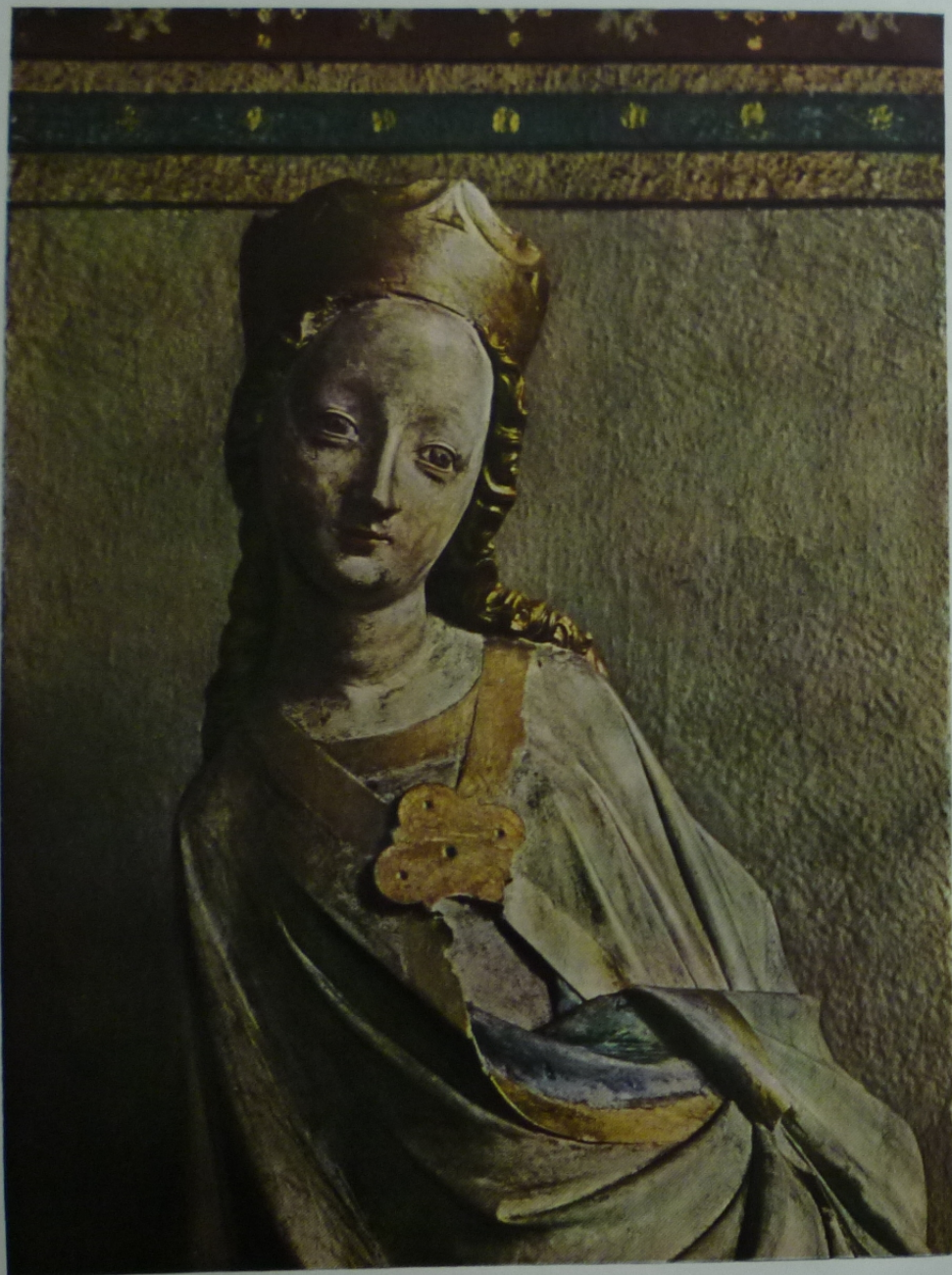
Sv. KATEŘINA, DETAIL, JIHLAVA, Sv. JAKUB, KOLEM 1400