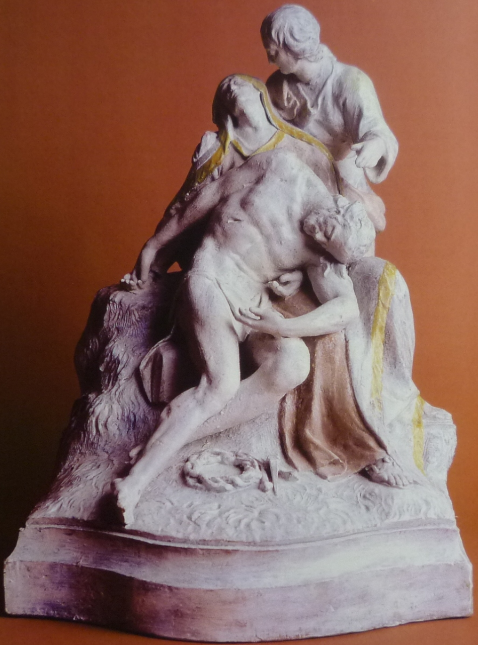
Johann Baptist Hagenauer, Oplakávání Krista. Moravská galerie v Brně.