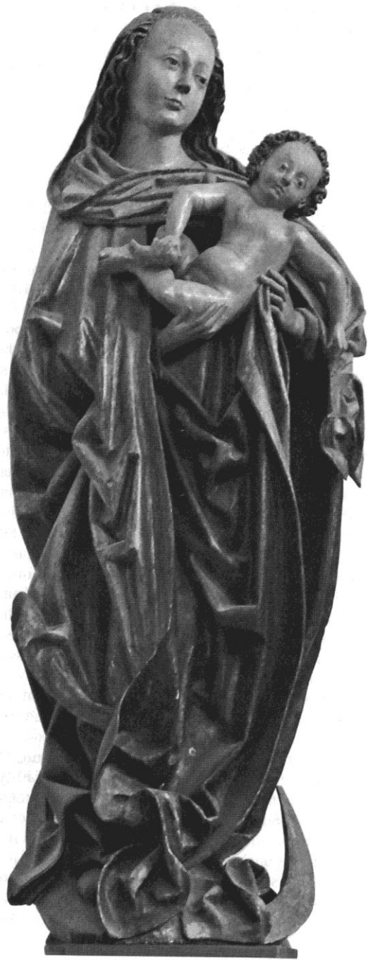
Madona ze Strážnice, 1470 - 90