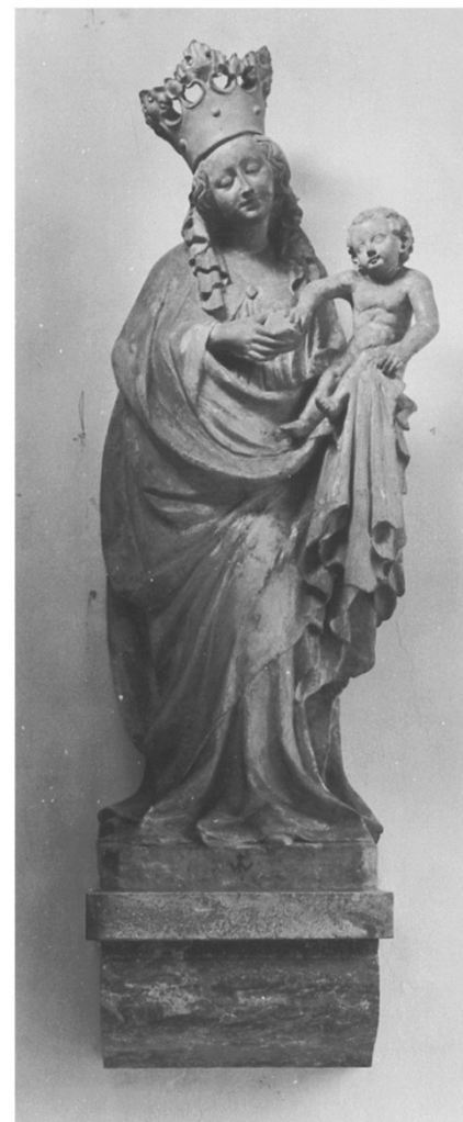
Madona, Horb am Neckar, kol. roku 1400