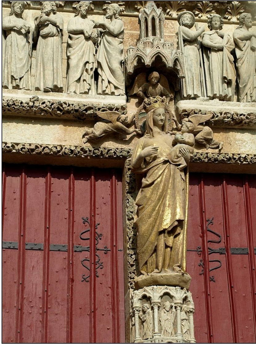
Tzv. Vierge Dorée, ca. 1260, Amiens