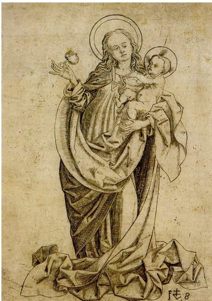
Veit Stoss, rytina, Konec 15. stol.