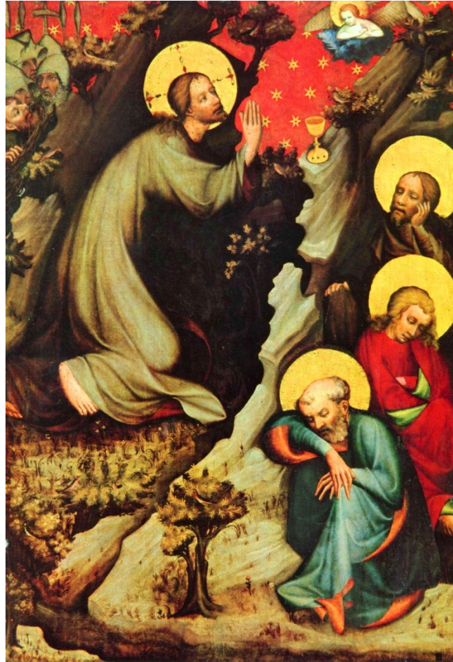
Mistr třeboňského oltáře, kol. 1380