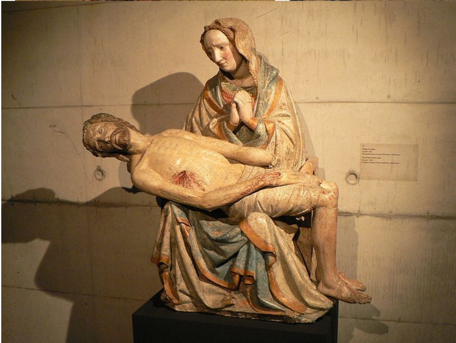
14 Pietà di Luffa Luffa, 1400 Riproduzione della Pietà di Luffa The Pietà from Luffa Luffa, 1400 Riproduzione della Pietà di Luffa