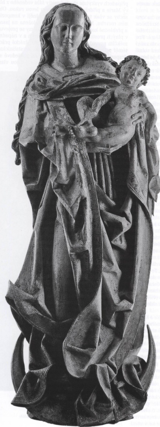
Madona z Brna, 1470 - 90