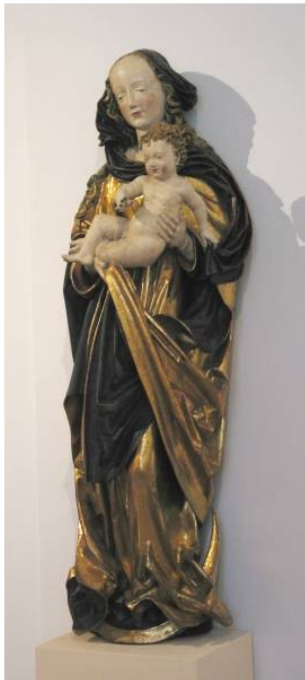
Madona z Olomouce, zvaná Primavesi, 1470 - 90