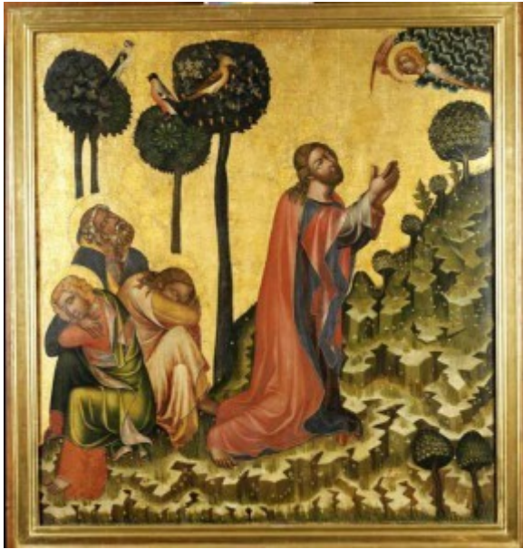
Mistr vyšebrodského oltáře, kol. 1380