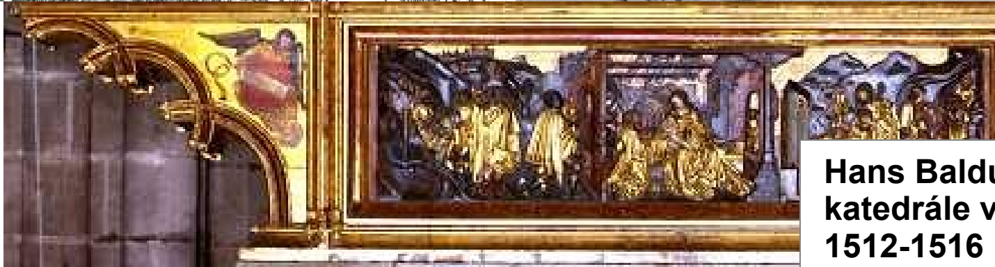
Hans Baldung Grien, oltář, katedrále ve Freiburg im Breisgau, 1512-1516