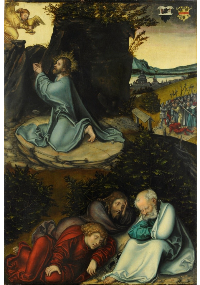
Lucas Cranach, dílna, 1540