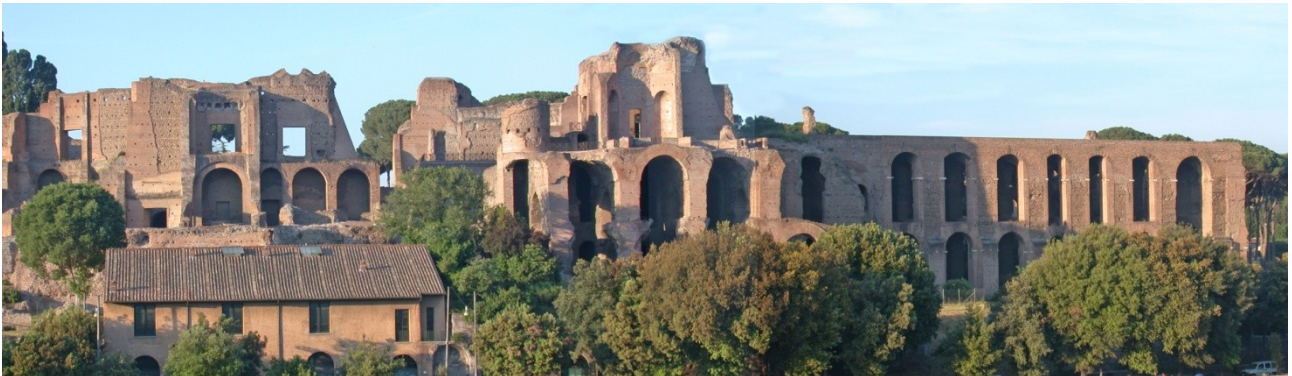
Vista dei Fori Romani verso il Circo Massimo

In effetti, scavi recenti hanno mostrato che delle popolazioni vi abitavano già nel 1000 a.C. circa. Si trattava di un villaggio di pochi ettari, circondato da paludi, dal quale era possibile controllare il corso del Tevere. Da questo primo agglomerato urbano si formò la cosiddetta "Roma quadrata", così chiamata dalla forma romboidale della sommità del colle su cui si trovava. Secondo la mitologia romana, il Palatino (più precisamente il pendio paludoso che collegava il Palatino al Campidoglio, chiamato Velabro) fu il luogo dove Romolo e Remo vennero trovati dalla Lupa che li tenne in vita allattandoli nella "Grotta del Lupercale", forse recentemente localizzata. Secondo questa leggenda, il pastore Faustolo trovò gli infanti e, assieme a sua moglie Acca Larentia, allevò i bambini. Quando Romolo, ormai adulto, decise di fondare una nuova città, scelse questo luogo. La casa Romuli effettivamente era una capanna ricostruita e restaurata più volte, situata nell'angolo nord-ovest della collina, dove poi sorse la casa di Augusto. Scavi del 1946 hanno trovato in questo sito resti di capanne dell'Età del ferro, confermando la tradizione leggendaria.