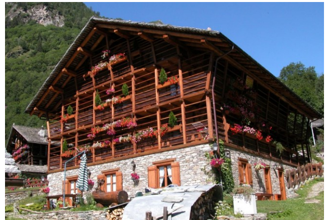
2 Casa Walser in Valsesia