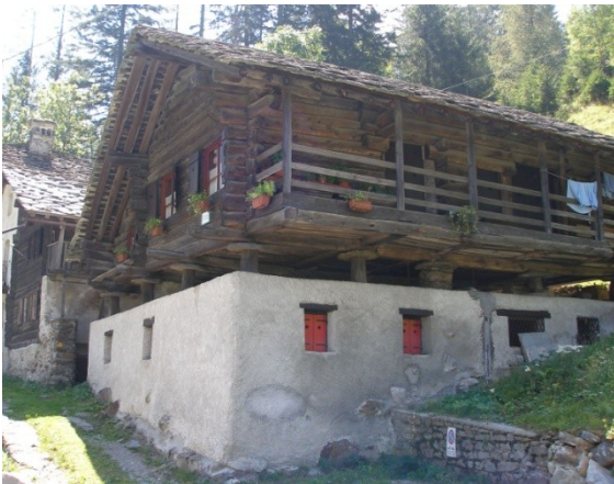
1. Casa Walser nella valle di Lys

4. Le case Walser non sono tutte uguali: osservate le foto qui proposte provate a descriverle e/o sottolinearne le differenze.