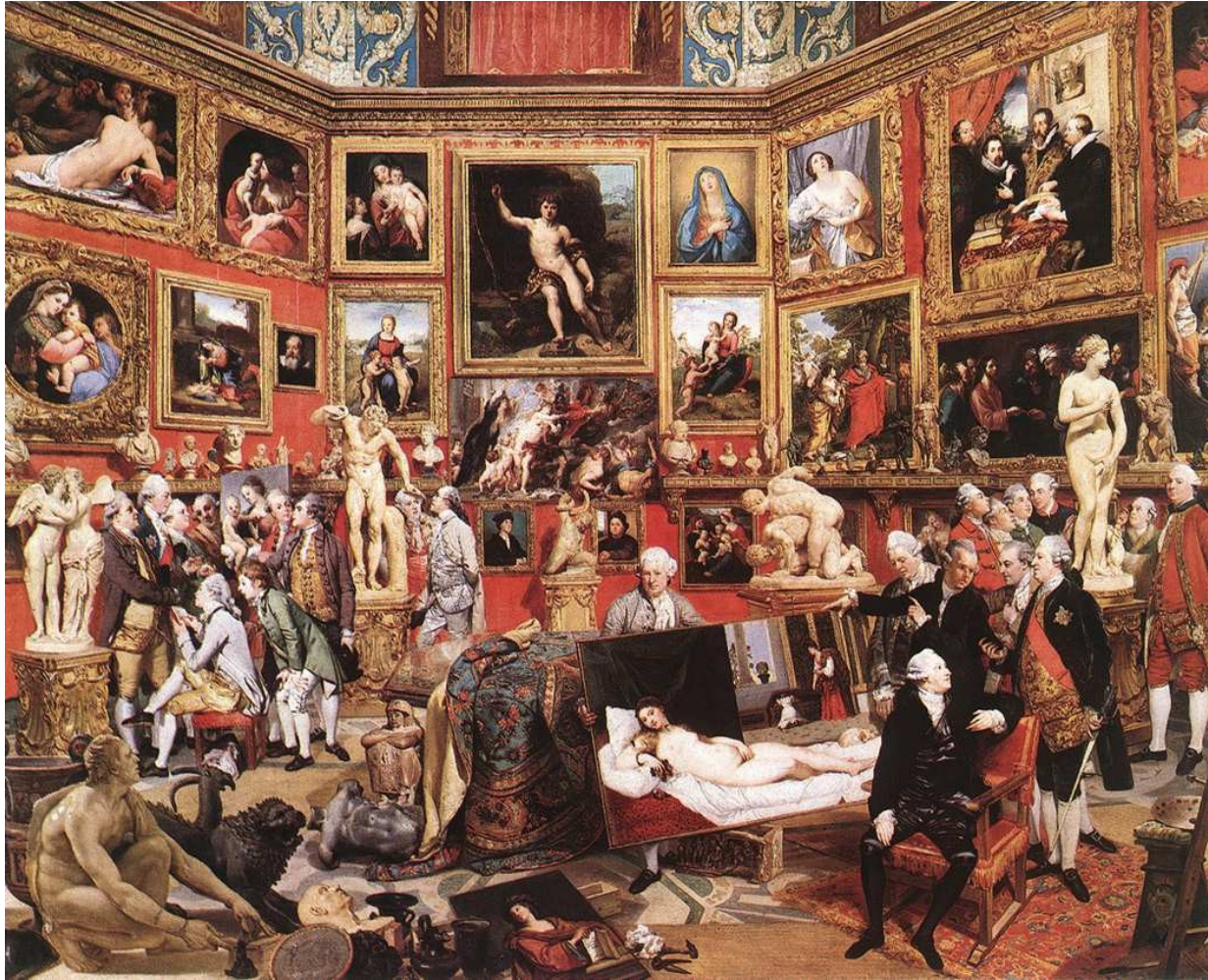
Johann Zoffany, Tribunové Uffizií, 1772-1778