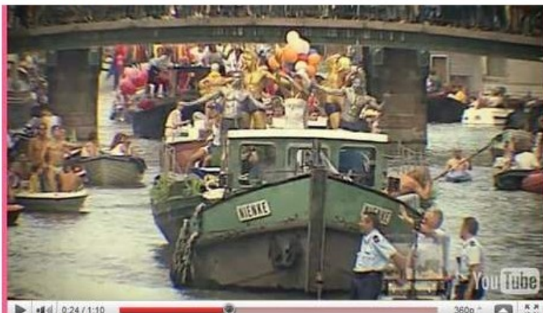
Screenshot van de trailer van Haantjes.

RECENSIE Hoogstaand amusement in Haantjes van Kluun. Of: hoe Stijn van Diepen goud geld dacht te verdienen aan de Gay Games in Amsterdam.