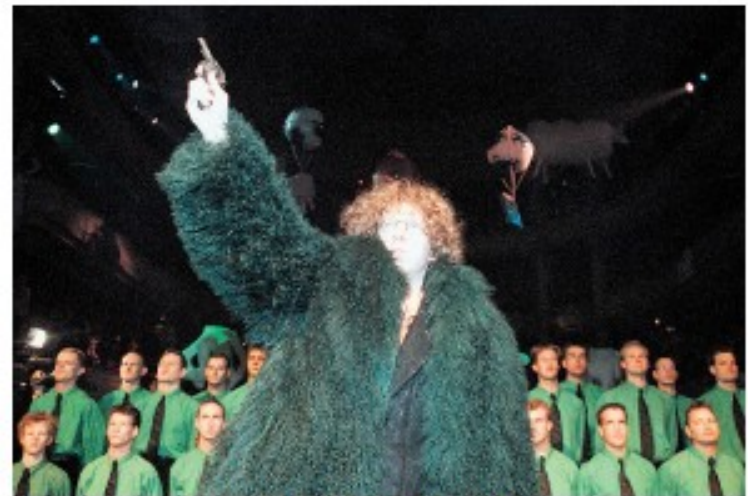
Eregast Arnon Grunberg opent het bal, 1998.