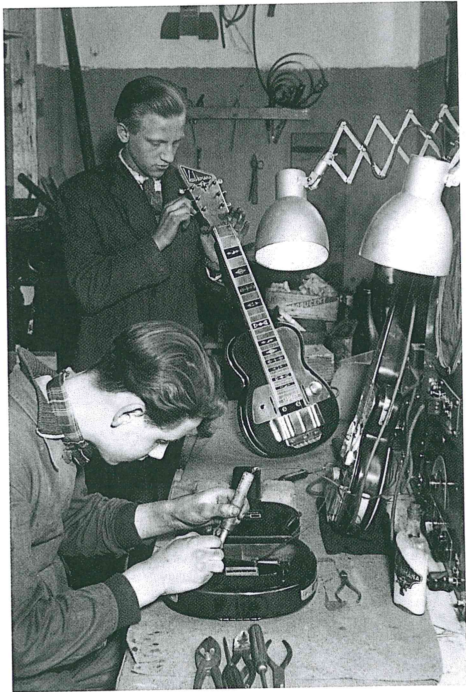
3 Hawaïiangitaarbouwers van de fabriek Vox Humana in Rotterdam in oorlogstijd.