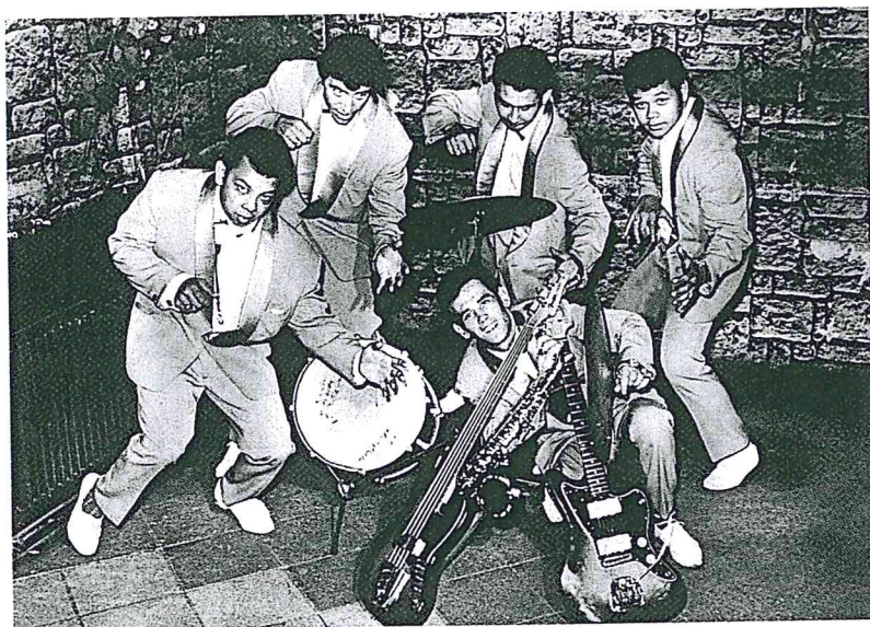
4 The Black Dynamites, een van de eerste Indobands die als beroeps- orkest naar Duitsland gingen.

Indische jongeren kregen het alternatief voor de zoete hawaïaanmuziek van hun ouders in de schoot geworpen. De gitaar hadden ze al in huis, de basgitaar bouwden ze zelf van hardhout en pianosnaren, de benodigde elektronica was niet moeilijk in elkaar te knutselen en spelen maar. De eerste rock-'n-rollbands ontstonden dan ook in de huiskamer en vonden hun publiek in het Indische feestcircuit, dat vooral in Den Haag omvangrijk was. Daar draaide in de nazomer en herfst van 1956 de Hollywoodfilm Rock around the clock dan ook het langst. Veel Indo's zagen hem meer dan één keer, vanwege de muziek, maar ook om te kijken hoe er op rock-'n-roll gedanst hoorde te worden.