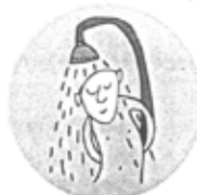
brać prysznic, biorę, bierzesz