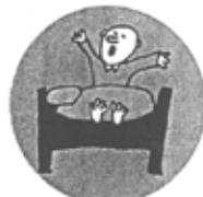
wstawać, wstaję, wstajesz