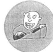
myć zęby, myję, myjesz