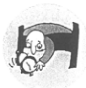
budzić się, -ę, -isz

jeść, -m, -sz śniadanie pić, piję, pijesz kawę iść, idę, idziesz do pracy pracować, -ę, -esz jeść obiad robić, -ę, -isz zakupy wracać, -m, -sz do domu oglądać, -m, -sz telewizję czytać, -m, -sz książkę iść na spacer iść spać spotykać, -m, -sz się z kolegą rozmawiać, -m, -sz przez telefon spać, śpię, -isz