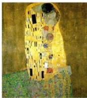
The Kiss Der Kuss