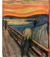
The Scream Der Schrei