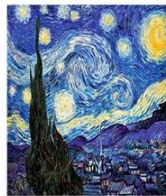
The Starry Night Die Sternennacht