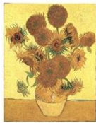
Vase with 12 Sunflowers Vase mit 12 Sonnenblumen

Pablo Picasso Vincent van Gogh Claude Monet