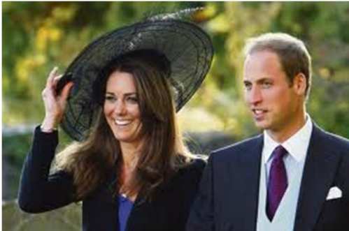
? die Engländer Prinzessin und Prinz von Großbritannien und Nordirland auch Herzogin und Herzog von Cambridge 33