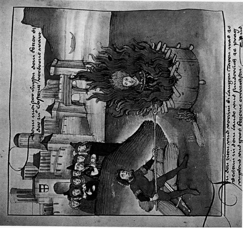
Die Verbrennung des Jan Hus in der sog. Spiezer Chronik (1484/85) von Diebold Schilling d. Ä.

mel, dann legte er Holz und Stroh um ihn herum, schüttete Pech dazu und zündete alles an. Da schrie Hus laut und war bald verbrannt. Doch als er selbst schon verbrannt war, blieb doch die Inful im Feuer noch ganz. Da zerstiess sie der Henker, denn der Kardinal Pankratius 204 hatte ein großes altes Maultier, das gestorben und an der Stelle vergraben worden war, an der man nun Hus verbrannte. Wegen der großen Hitze tat sich das Erdreich auf, sodass der schlimme Gestank herauskam.