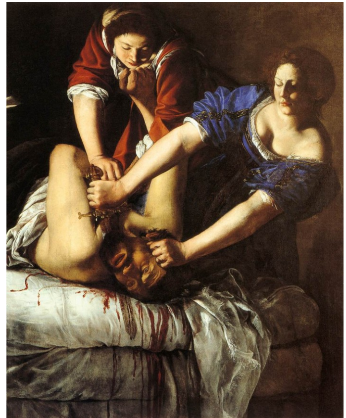
Artemisia Gentileschi Judita, 1611-1612