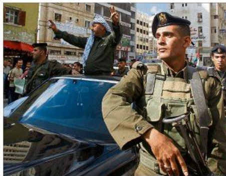
Yasser Arafat à Naplouse en Cisjordanie en novembre 2009, après une déclaration symbolique de l'indépendance de la Palestine.

Jean Asselborn, ministre luxembourgeois des Affaires étrangères, respecte l'initiative suédoise mais considère qu'il faut donner à un Etat palestinien les chances les meilleures. Or ces chances seront optimisées par une position com-