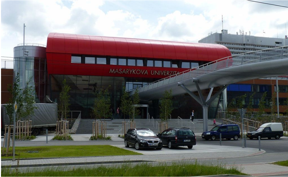
El campus universitario de La Universidad Masaryk