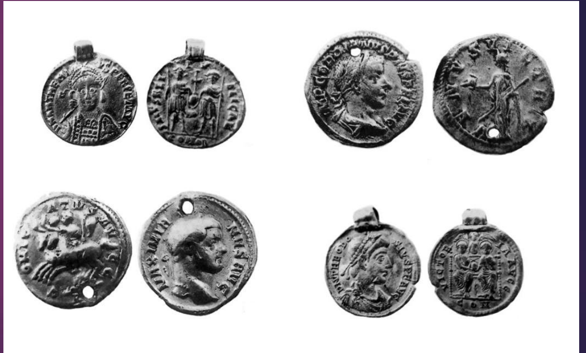
Obr. 1: Zelíková, M. 2015