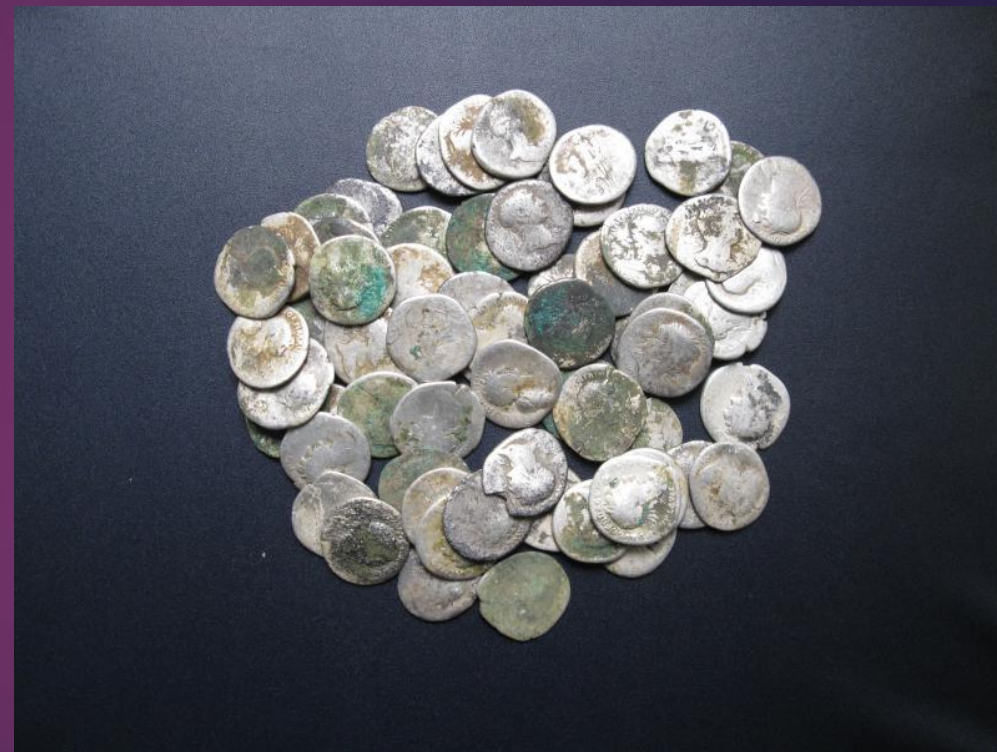
Obr. 4: foto Ostravské muzeum