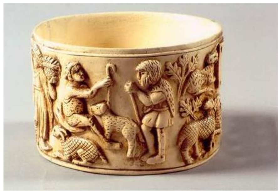
Rekonštruovaná pyxída so scénickými výjavmi