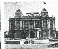
Hrvatsko narodno kazalište