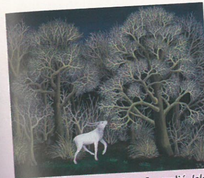
Ivan Generalić, Jelen

U Zagrebu postoji Hrvatski muzej naivne umjetnosti , a osnovane su i mnoge galerije naivne umjetnosti te slikarske i kiparske kolonije.