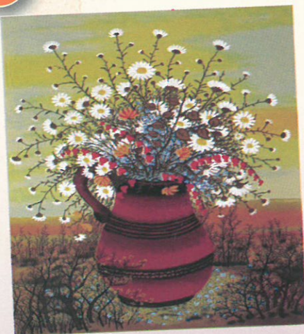
Ivan Lacković Croata, Cvijeće

Naivna je umjetnost amatersko slikarstvo i kiparstvo. Središte je hrvatske naivne umjetnosti u podravskom selu Hlebinama. Ondje se razvila takozvana Hlebinska škola . Naivna umjetnost ima ruralan likovni izraz, jasne boje, plošnost i socijalnu tematiku.