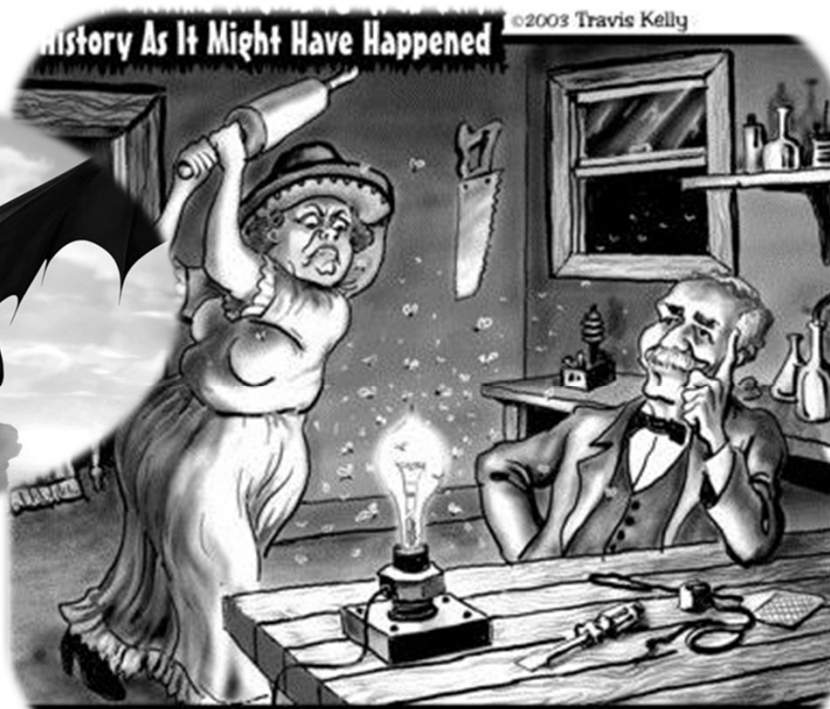
1879 -- Mrs. Edison vetoes the lightbulb