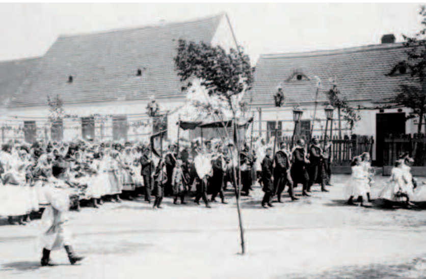
Veřejné oslavy svátku Božího těla se s ohledem na Habsburky pěstovaný kult eucharistie vymykaly státní regulaci. Udržely se tak jako jedny z nejdůležitějších katolických oslav. Božitélové procesí v Lanžhotě v roce 1902.