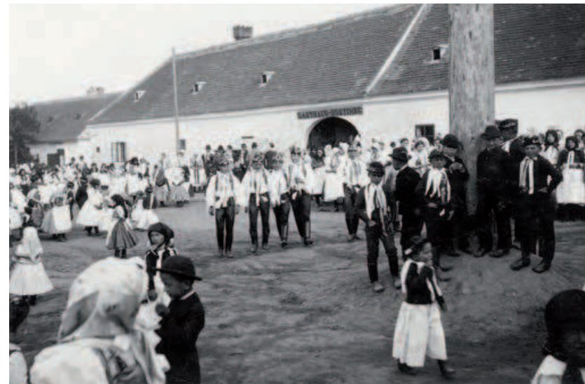
V Lanžhotě se termín hodů vrátil ke svátku zasvěcení farního kostela Povýšení svatého Kříže, který se slaví 14. září, v mnoha moravských venkovských lokalitách se ovšem ujal a až do dnešních dnů zůstal v platnosti státem nařízený termín oslav hodů – třetí neděle v říjnu.

V souvislosti s regulací poutního ruchu byla od roku 1782 postupně omezována také procesí uvnitř farností, až byla v roce 1785 zakázána všechna, vyjma procesí na svátek Božího těla a procesí konaných v prosebné dny. 42