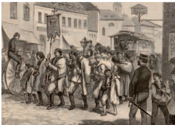
Anachronické způsoby náboženského chování vesničanů jako např. poutní průvody se stávaly kuriozitou. Zobrazení zachycuje takové vnímání ze strany redaktorů vídeňských novin. Ti procesí z Moravy do Mariázell konfrontovali s technickými vymoženostmi, které ve zkratce charakterizovaly dobu.

Jak vidno, vrchnostenské zásahy do náboženského života obyvatel byly vedeny formou zavádění novinek a zákazů jednotlivých způsobů chování (rituálů), které byly realizovány venkovany během jednotlivých svátků až po celé sváteční příležitosti. Zejména po odeznívání osvětského vzepětí státního aparátu se setkáváme ještě s jiným normativním diskurzem, a to opětovným povolováním. Razance osvětských zásahů do náboženských festivity totiž poněkud předběhla svoji dobu a roli sehrála jistě také změna na vídeňském trůnu po skonu Josefa II. v roce 1790. Tak již např. následujícího roku bylo biskupům umožněno s vědomím úřadů povolovat poutní průvody, avšak jejich obecný zákaz trval až do roku 1820. 51