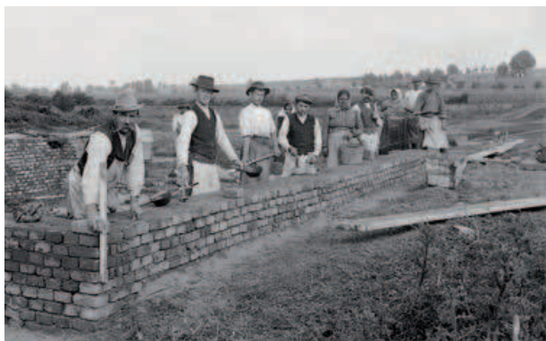
Použití pálených cihel při stavbě obvodového zdiva domu v Kněždubě (okr. Hodonín).

(1865–1944) z Moravského Slovenska: „ Těchto [pálených cihel] se však užívá obvykle jen při budování rohů, pilířů dveřních nebo při klenbách, takže stavba z nich tvoří jakousi kostru, jejíž ostatní stěny vyplňují vepřovice. Základy jsou ovšem tvrdé, kamenné. Selská stavění z doby nejnovější [...] mají stěny už cele tvrdé, pálené. Ale to jsou domy, které s rázem starého domácího a Slovensku vlastního života mají už málo společného. “ 25