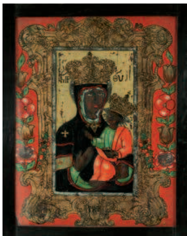
V kontextu soupeření Brna a Olomouce o prvenství v zemi vedla brněnská korunovace Panny Marie Svatotomské k vytvoření protiváhy poblíž Olomouce sídlící a již korunované Panně Marii Svatokopectké. Podmalba na skle Panny Marie Svatotomské.

Povinné zavedení kropenek do interiérů obyvatelstva reflektovala nabídka různých producentů, v případě této kropenky vyškovských toufarů – výrobci fajánsových keramiky.