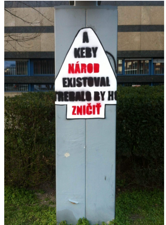
„A keby...“ Mlynské nivy, 21.3.2016, Bratislava

Od Francúzskej revolúcie po koniec 1. svetovej vojny