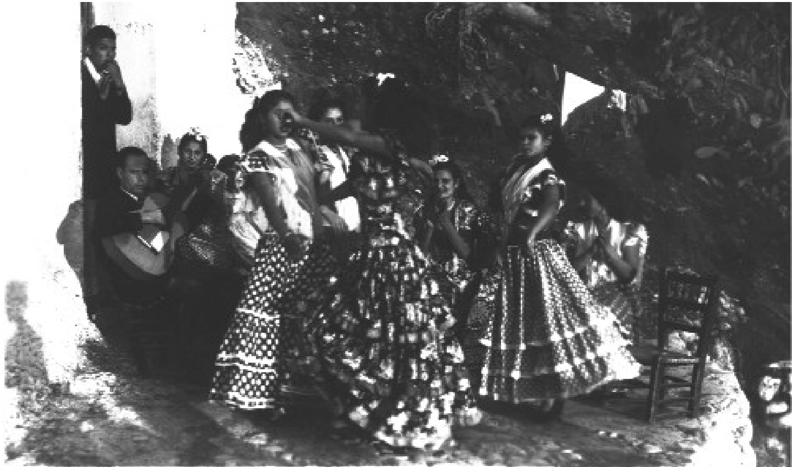
65) GRANADA Citanas del Sacro Monte Citanes du Sacro Monte L. Reiss-Pere