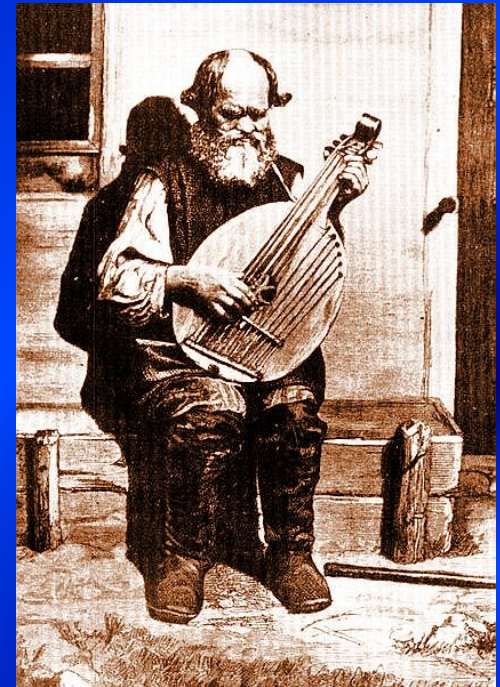
Kobzar Ostap Veresaj 2. pol. 19. století