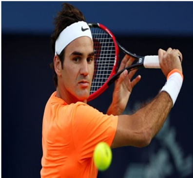
? ein Schweizer Tennisspieler 34