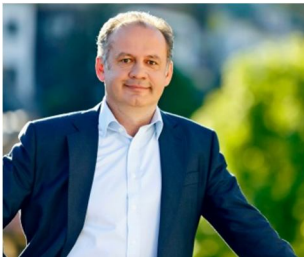
? der Slowake ein slowakischer Präsident 53

Die Dame auf dem Bild heißt/ist ... Sie kommt aus Deutschland und spricht Deutsch. Sie ist deutsche Bundeskanzlerin. Sie ist 61 Jahre alt.