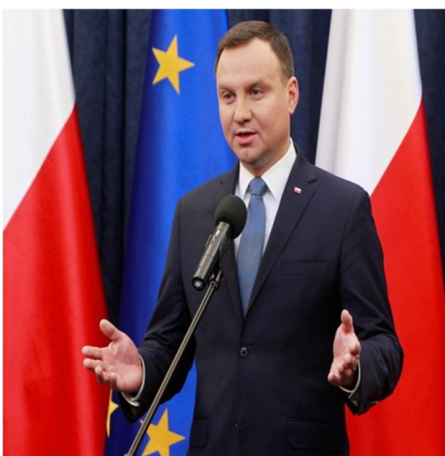
Andrzej Duda der Pole ein polnischer Politiker und seit August 2015 Präsident der Republik Polen 43