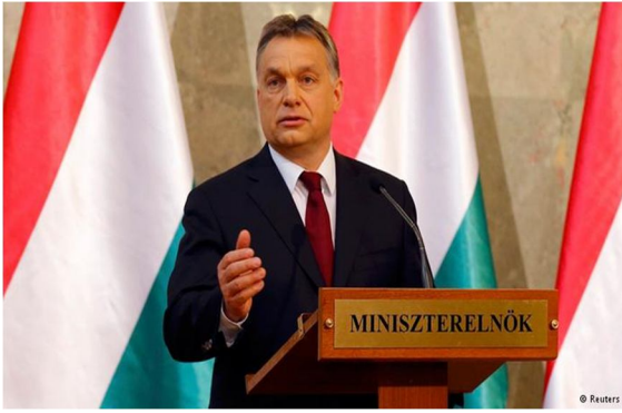
? der Ungar ein ungarischer Politiker und Ministerpräsident von Ungarn 52