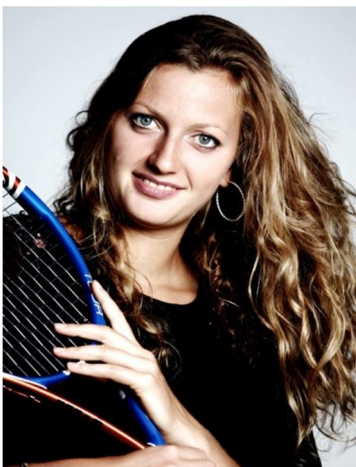
? die Tschechin eine tschechische Tennisspielerin und Gewinnerin von Wimbledon 25