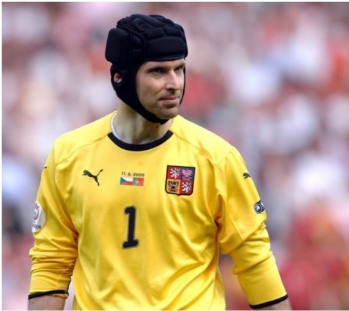
? der Tscheche ein tschechischer Fußballspieler 33