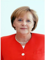
Angela Merkel die Deutsche Bundeskanzlerin 61

Die Dame auf dem Bild heißt/ist ... Sie kommt aus Deutschland und spricht Deutsch. Sie ist deutsche Bundeskanzlerin. Sie ist 61 Jahre alt.