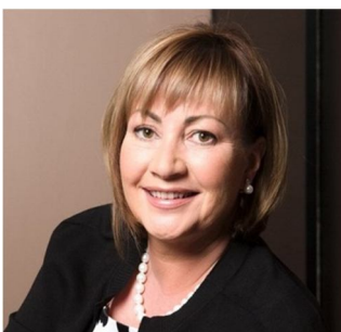
? die Tschechin eine Ehefrau des tschechischen Präsidenten 50