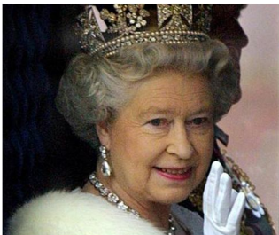
? die Engländerin eine britische Königin 89