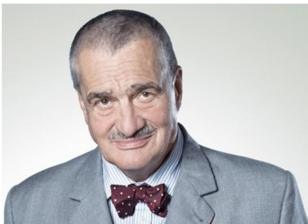
? der Tscheche ein tschechischer „Fürst“ und Politiker 78