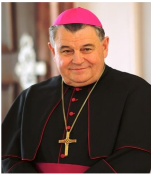
? der Tscheche Erzbischof von Prag 72