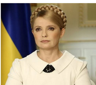
? die Ukrainerin eine ukrainische Politikerin 55