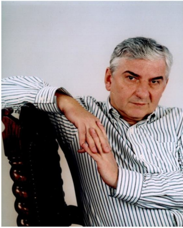
? der Tscheche ein tschechischer Schauspieler 65