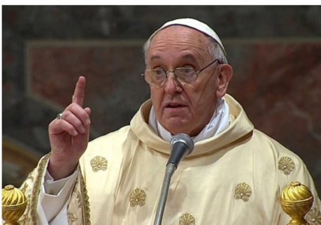
? der Argentinier der Papst 79