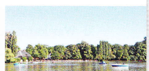
○ Kleinhesseloher See

Nach einem Kilometer komme ich zum Chinesischen Turm. Den finde ich besonders toll. Er ist 25 Meter hoch und ganz aus Holz. Auch hier gibt es einen Biergarten. Er hat 7.000 Sitzplätze und ist bei Einheimischen und Touristen sehr beliebt. Manchmal spielt im Turm eine bayrische Blasmusik für die Gäste.