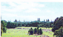
1 Blick vom Monopteros