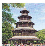
○ Chinesischer Turm