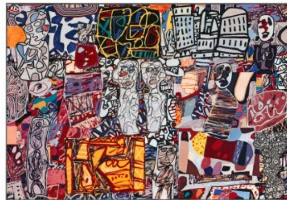
J. Dubuffet Théâtres de mémoire THE PRICE GALLERY 32 EAST 57TH STREET NEW YORK, NEW YORK 10022 MARCH 26TH 1977 - APRIL 23RD 1977