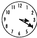
10 voor half 4