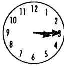
kwart over 3