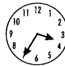
5 over half 4