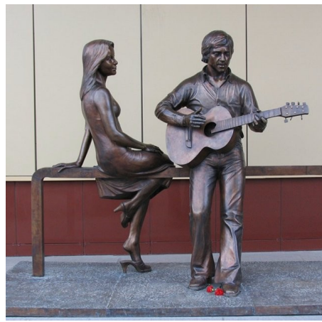
Памятник Владимиру Высоцкому и Марине Влади