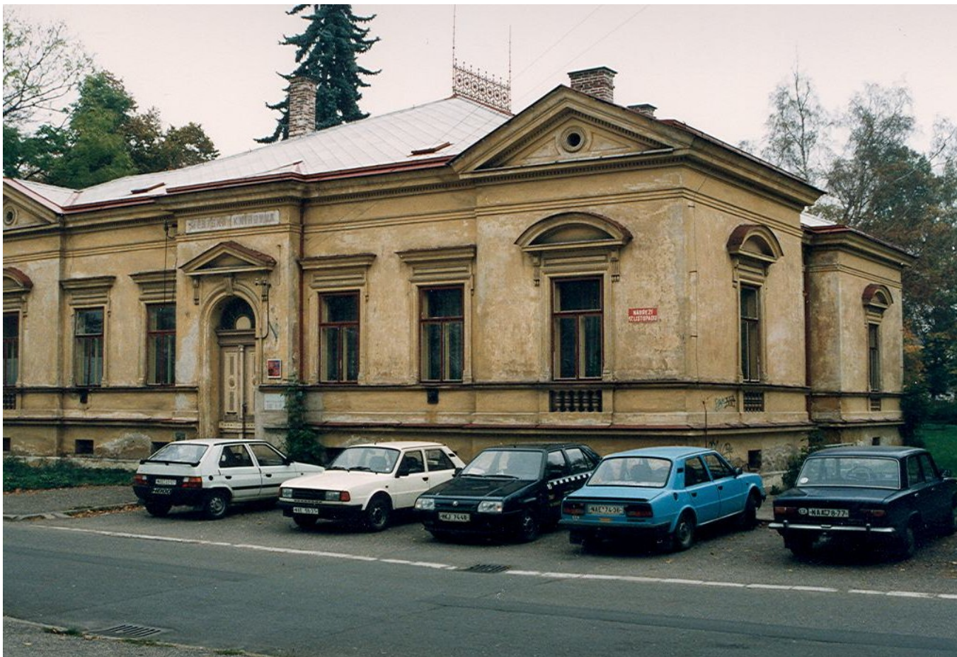
Rok 2000 - knihovna před rekonstrukcí