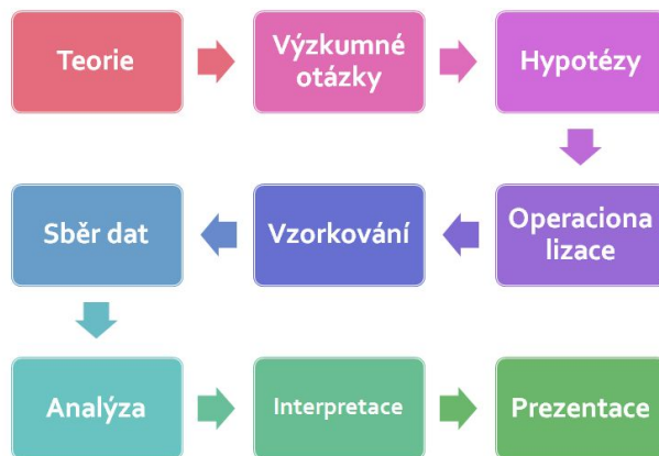
Schéma kvalitativního výzkumu: