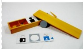
Pokročilé gramatické symboly s krabičkou