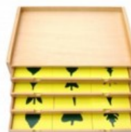
Botanická komoda s listy