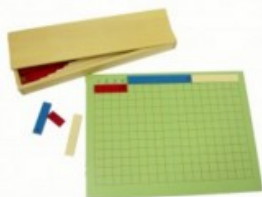
Odčítací proužková tabule