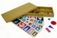
Malé gramatické symboly s krabičkou