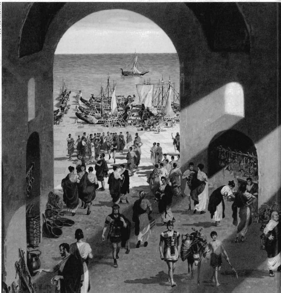
Přijdou temná staletí, ale Evropa z nich vyjde silná. (Tržišť v době římské říše)