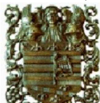
Obrázek 1 Městský erb, 2017