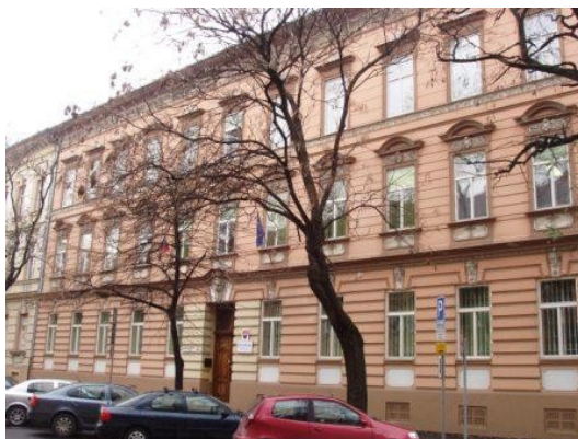
Budova Štátneho archívu v Košiciach, Bačíkova 1, 040 01 Košice-Staré Mesto

Mezi nejvíce využívané archivní sbírky patří sbírka církevních matrik z roku 1587-1895. Matriky obsahují biografické záznamy významných osobností, např.: Pavla Jozefa Šafárika, Jonáše Záborského, generála Rudolfa Viesta a Bélu Gerstera (autora projektu korintského průplavu a spoluprojektanta Panamského průplavu).