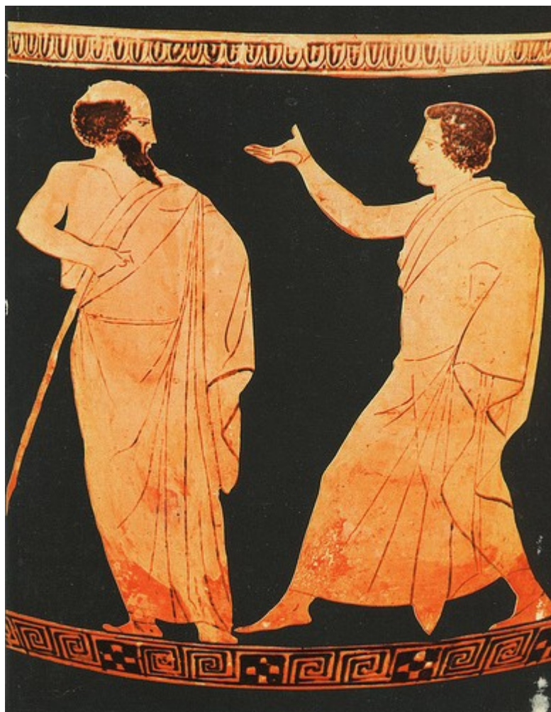
PLATON vs. SOFISTÉ (zde Gorgias)