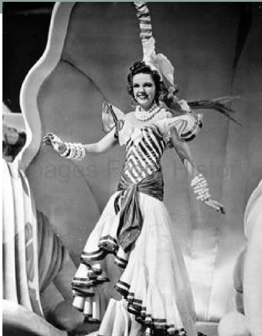
Ziegfeld girl (1941)