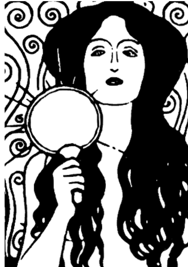
Detail jeho přípravné kresby k obrazu