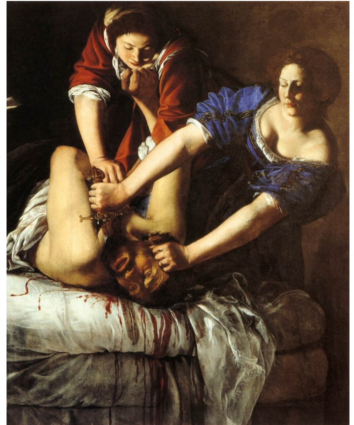
Artemisia Gentileschi Judita, 1611-1612