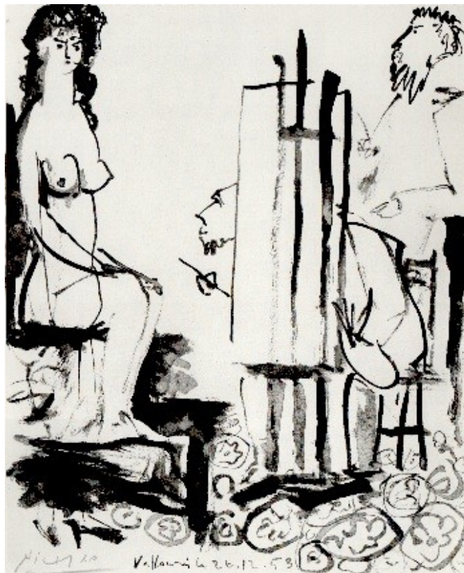
Pablo Picasso, Sedící model, grafika, 1954