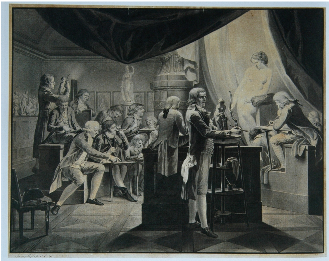
Ludvík Kohl, Pohled do umělcova ateliéru, 1799