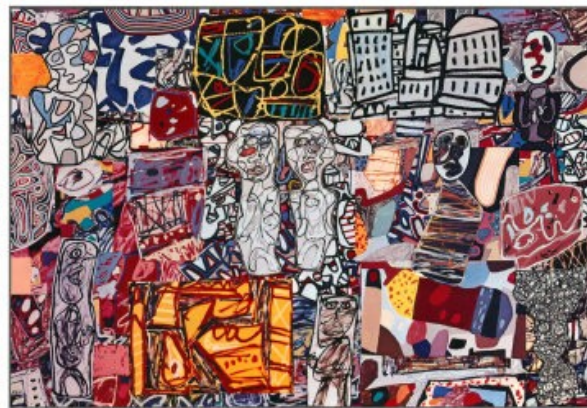
J. Dubuffet Théâtres de mémoire THE PRICE GALLERY 32 EAST 57TH STREET NEW YORK, NEW YORK 10022 MARCH 26TH 1977 - APRIL 23RD 1977