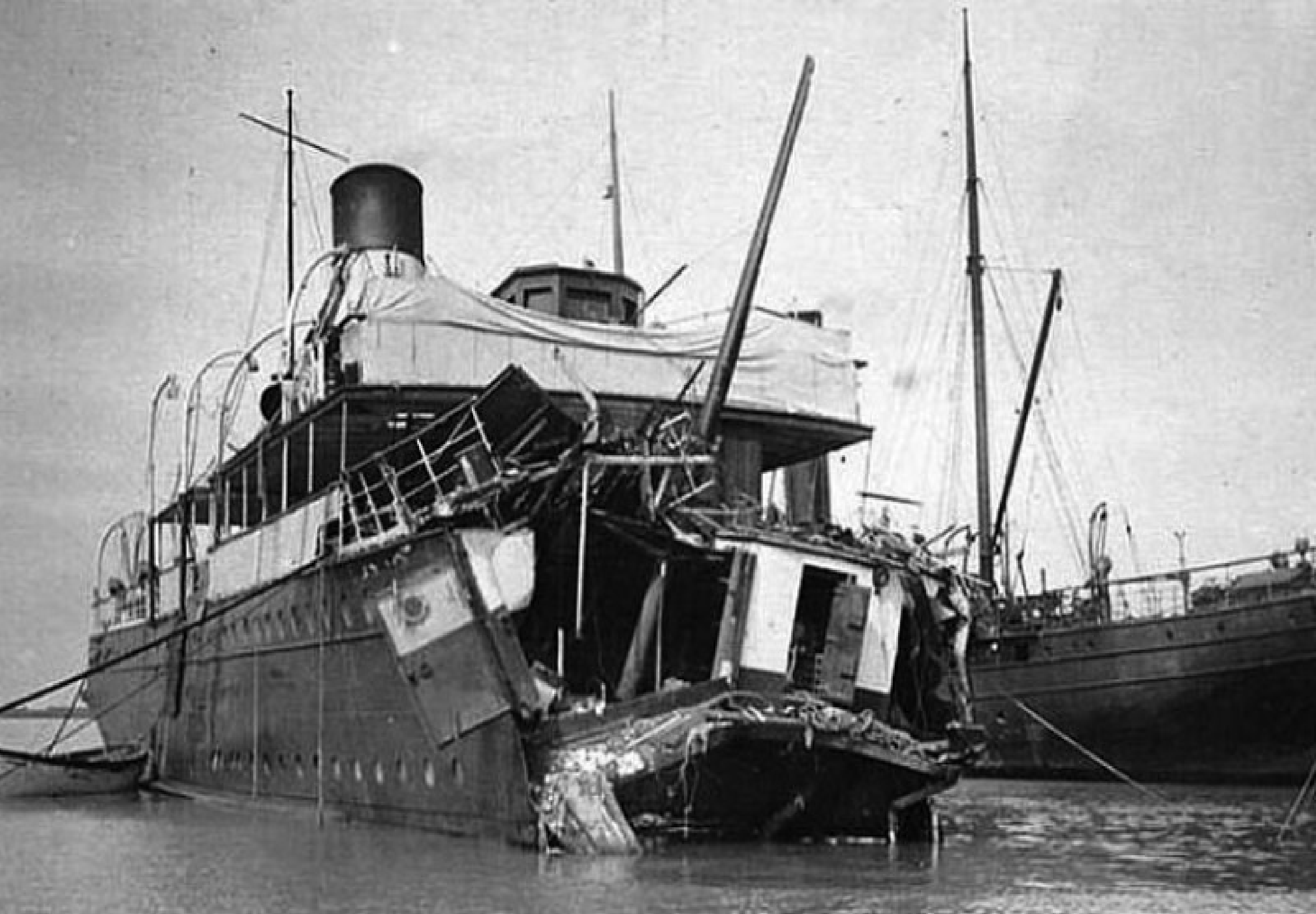
Vrak lodi Sussex (1916)