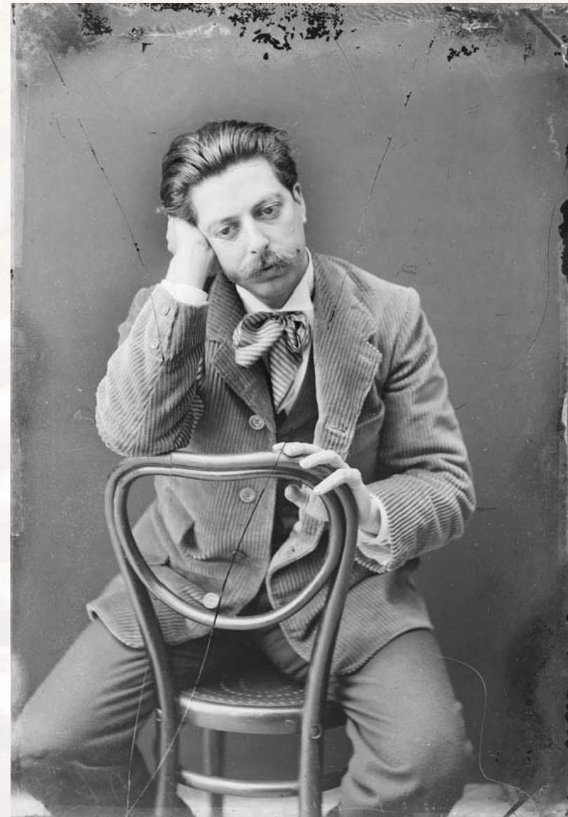
Enric Granados