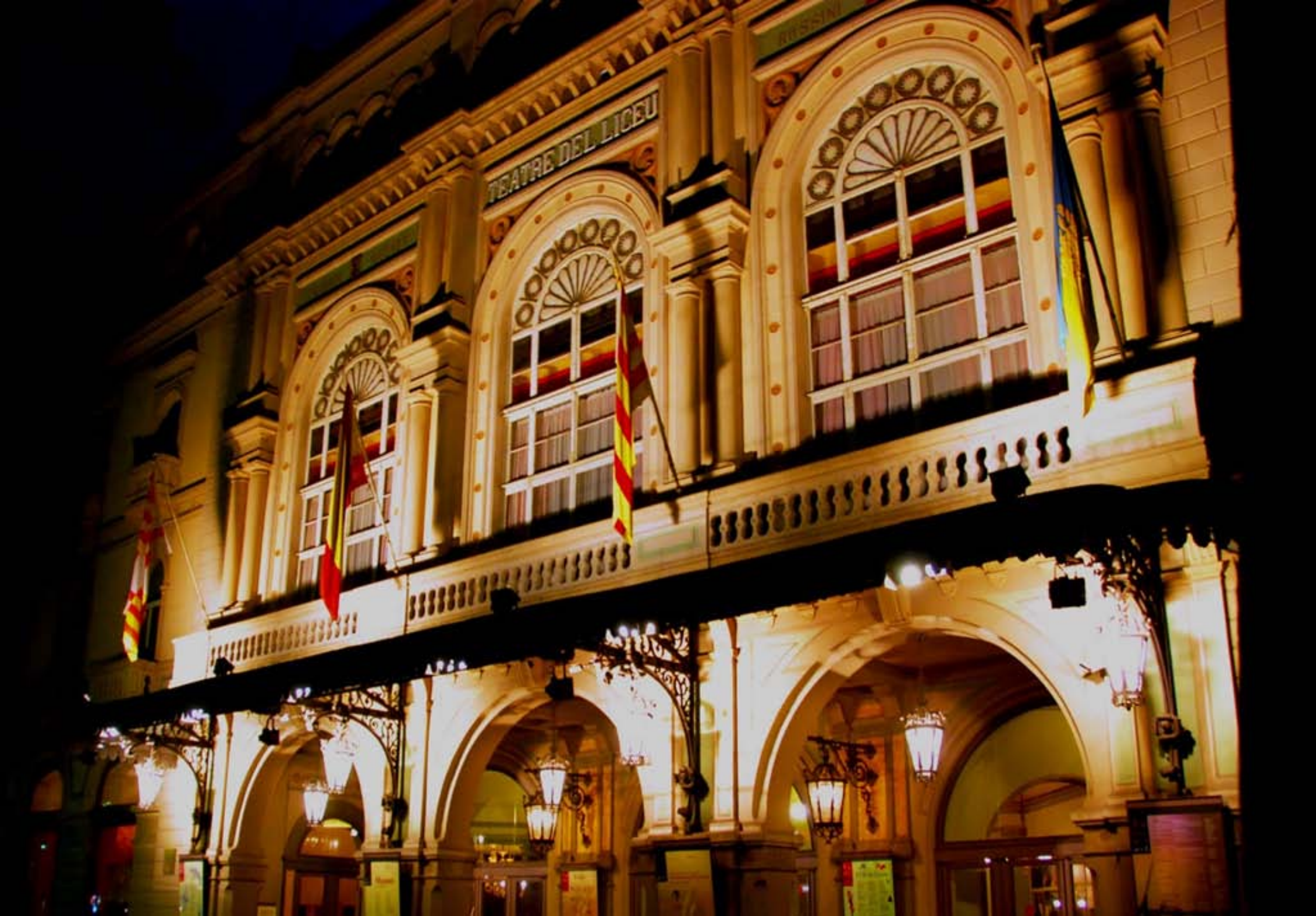
Liceu - exteriér