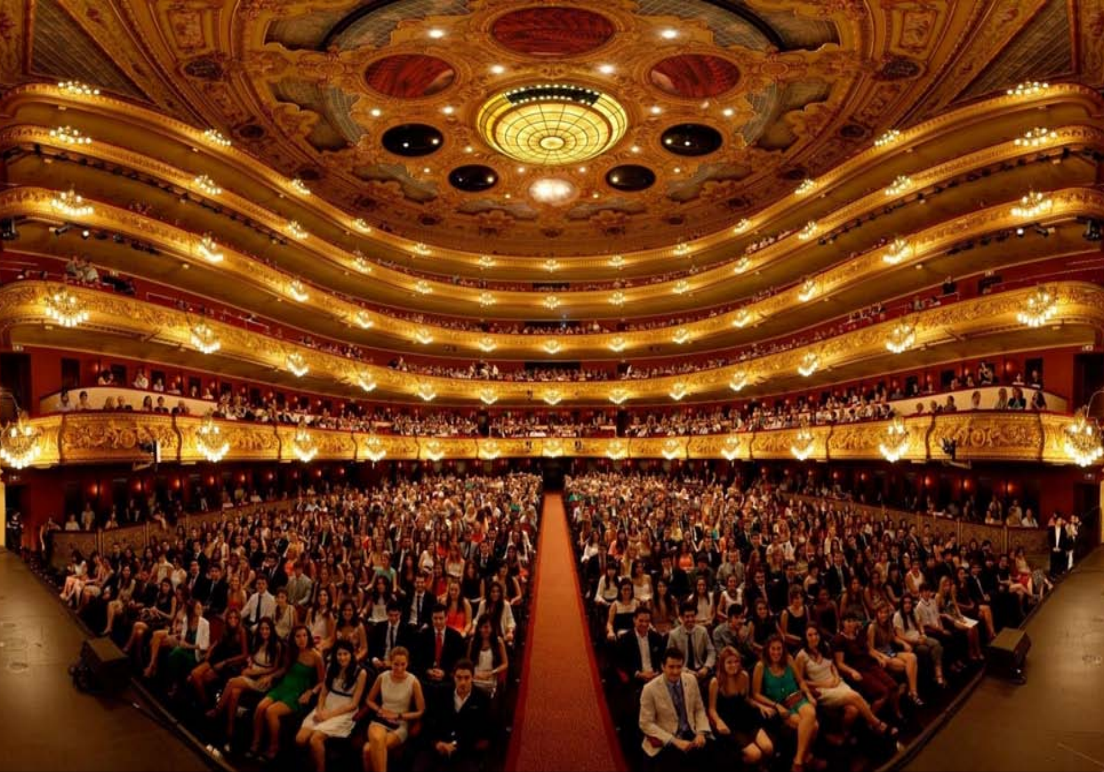
Liceu - interiér