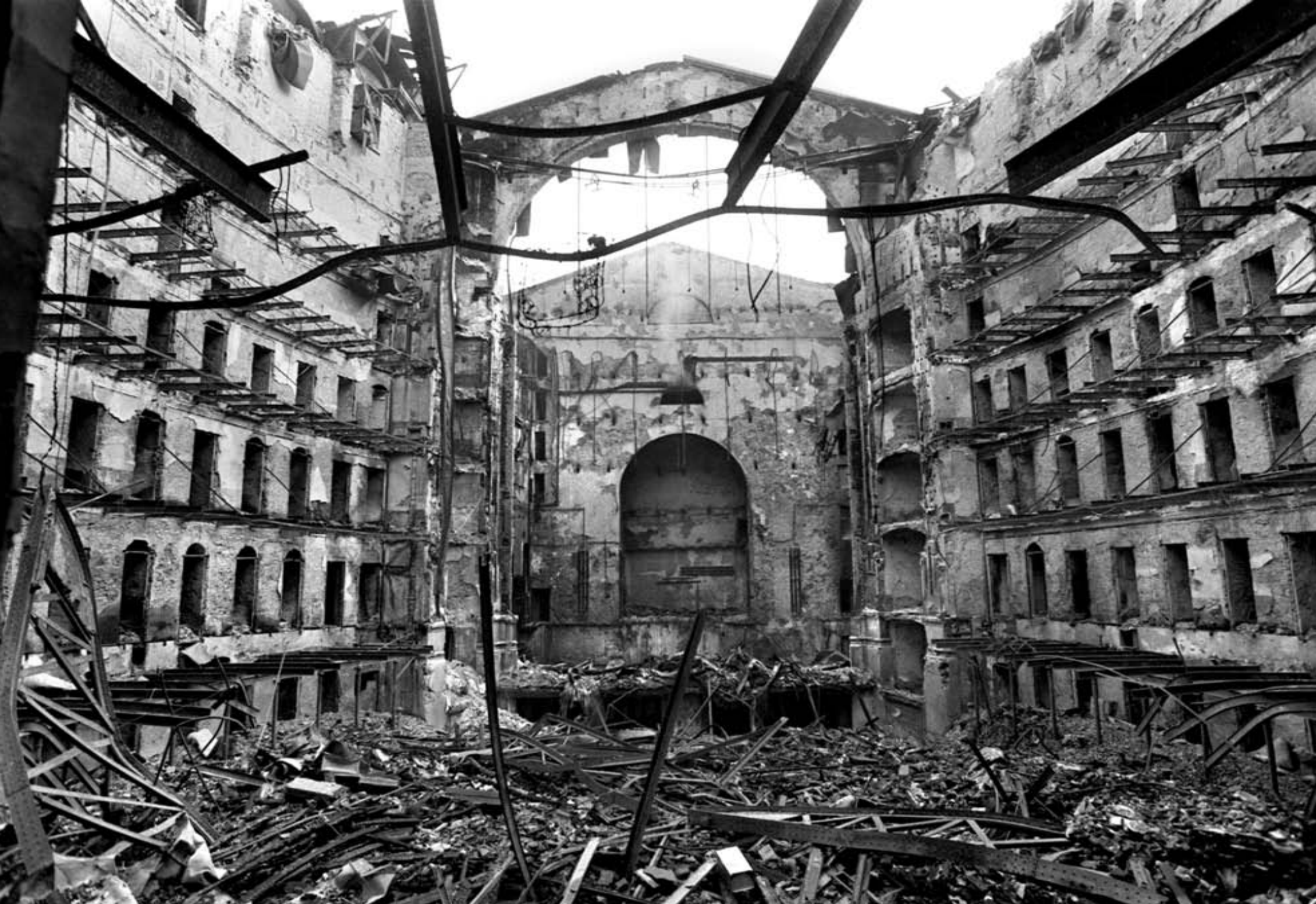
Liceu po ničivém požáru v roce 1994